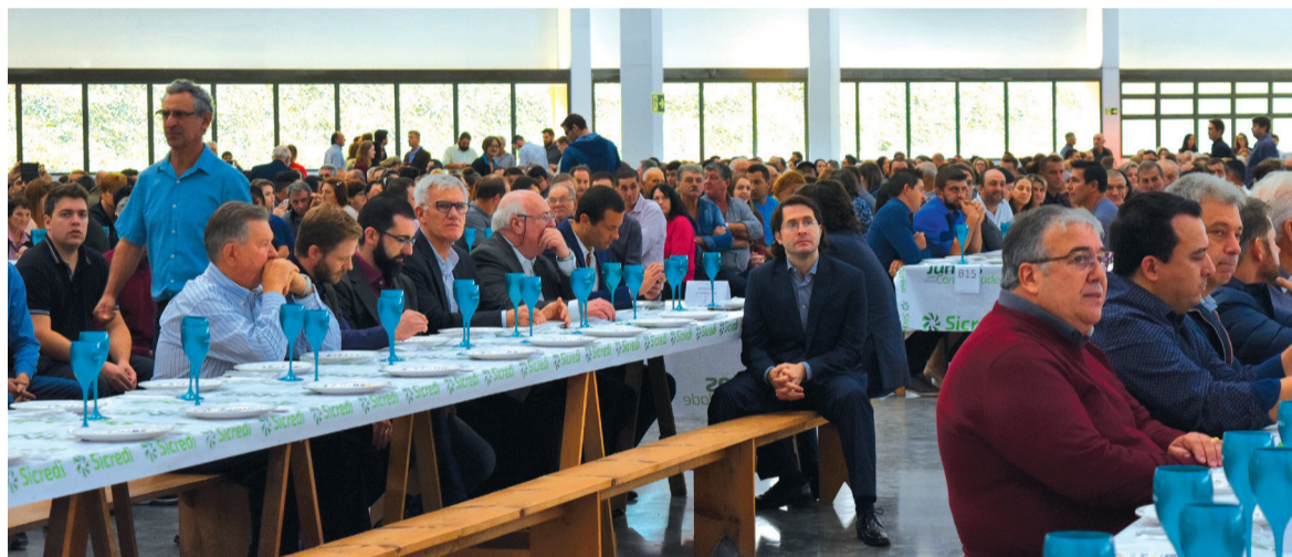
3,5 mil pessoas prestigiaram a solenidade de inauguração da nova unidade industrial