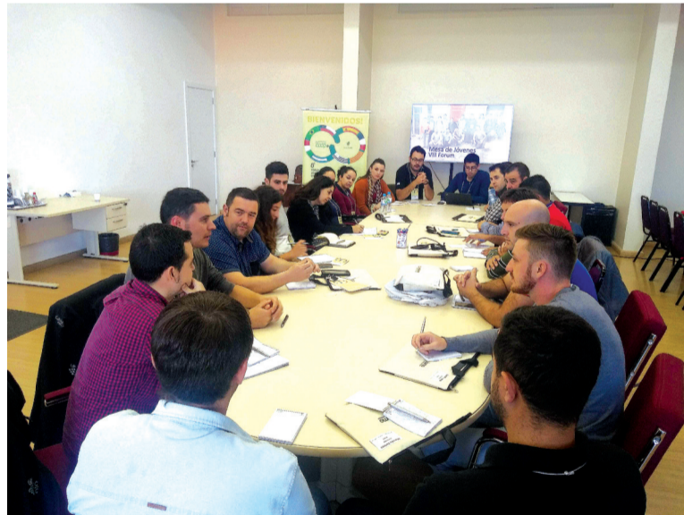
Encontro dos jovens discute práticas e estratégias para permanência do jovem no campo