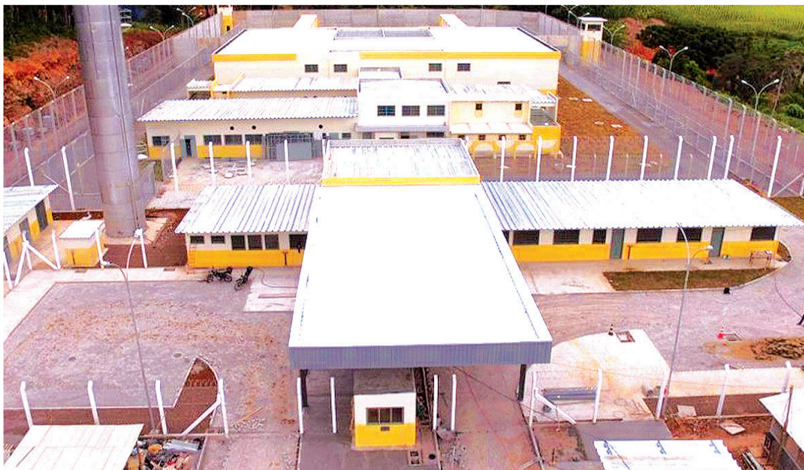
Mesmo com estrutura concluída desde abril segundo informações da Susepe, e com a garantia do vice-governador para inauguração em abril, a penitenciária ainda não tem data prevista de inauguração