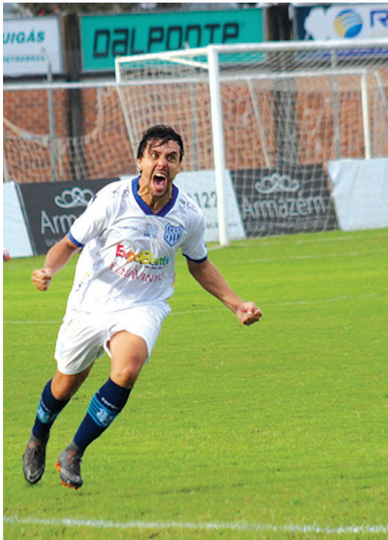
Esportivo está na semifinal em busca da conquista de vaga na Divisão Principal do futebol gaúcho

Guarani-VA neste domingo (5) no Estádio Edmundo Feix em Venâncio Aires, e o próximo jogo do confronto será no Parque Esportivo Montanha dos Vinhedos em Bento Gonçalves no domingo (12), às 15h30m.