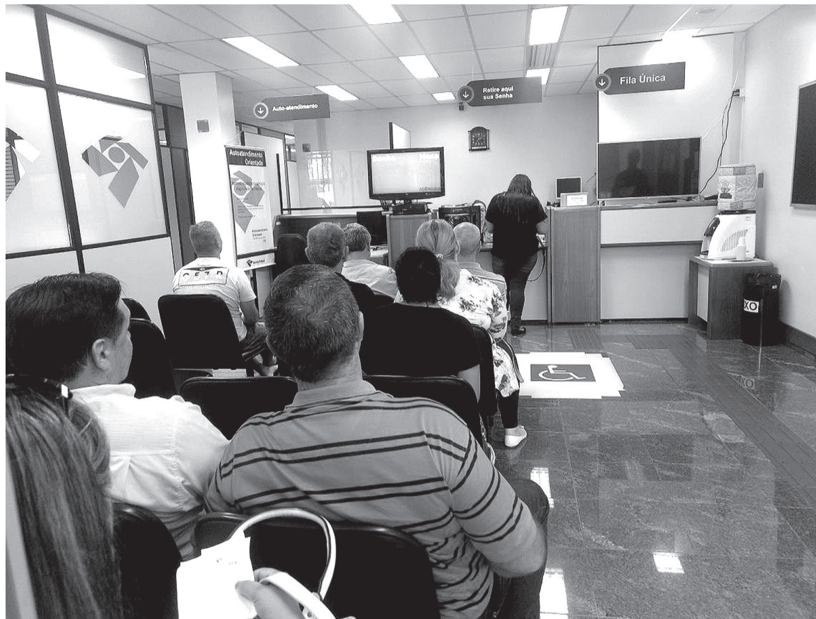
A Receita Federal registrou 7,37% de aumento das declarações de IR entregues no prazo em comparação com 2018 em Bento Gonçalves

Em Bento Gonçalves, os números de declarações de Imposto de Renda superaram as expectativas da Receita Federal, que informou que houve um crescimento de 7,37% em comparação com o ano passado. O total de contribuintes que entregou a declaração dentro do prazo foi de 31.745.