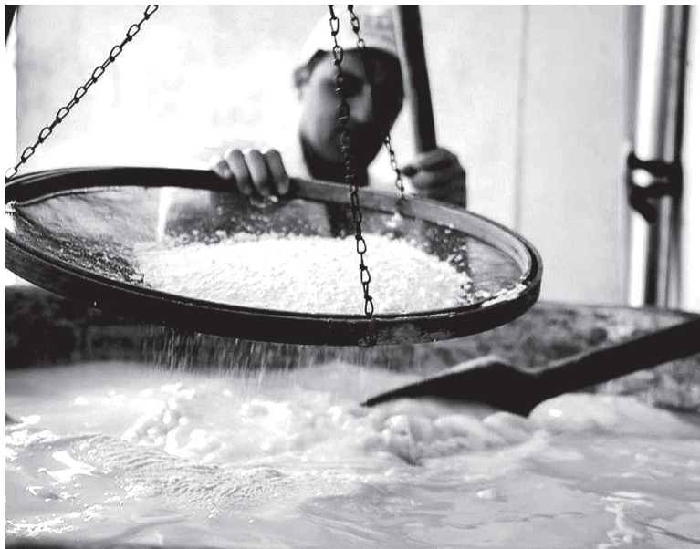
Entre os dias 18 e 19 de maio, ocorre a 10ª edição do Polentaço

Para comemorar esse legado gastronômico, várias atrações artísticas – e gratuitas – envolvendo cantoria e danças típicas foram combinadas à programação culinária da festa, cujo ponto alto é o tombo de 800 quilos de polenta. A virada da polenta gigante ocorrerá em duas ocasiões, no dia 18, às 17h15min, e no dia 19, às 14h30min. Ao redor da praça, vários empreendedores locais oferecem, em barraquinhas, diversas expe-