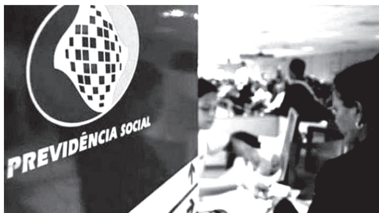
Caso não haja verba, os aposentados, pensionistas e demais beneficiários do INSS sentirão os reflexos a partir de julho

Pessoas que recebem pagamentos do INSS tais como aposentados, pensionistas e usuários do programa Bolsa Família, podem ficar no prejuízo caso o Congresso não dê a autorização dos pagamentos ao governo.