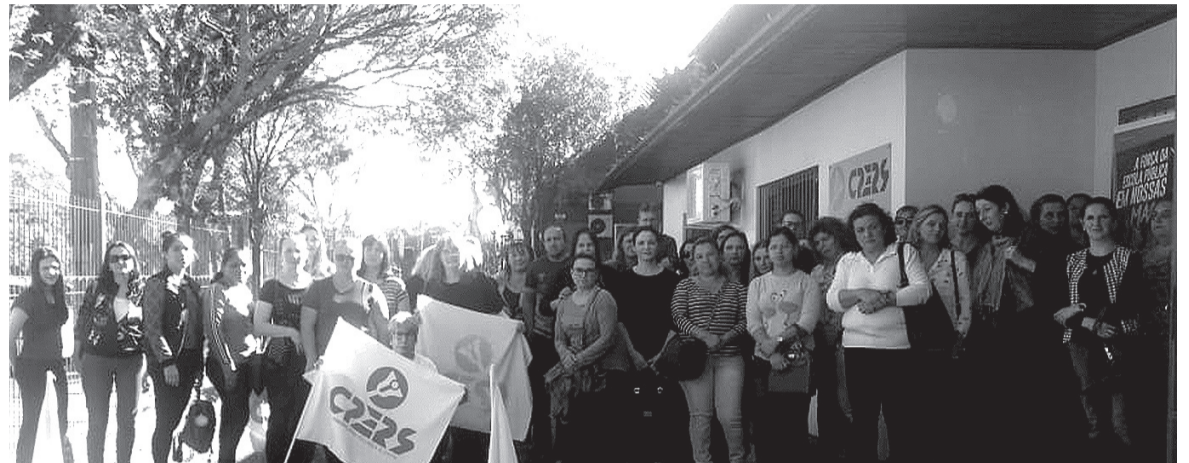
Professores que aderiram à paralisação em Bento Gonçalves

Durante a reunião, a Presidente entregou cópia de seu contracheque ao governador e disse: “tenho 30 anos de magistério, governador. Lhe pergunto: 28,78% é muito em cima disso? Não queremos trabalhar com outra coisa. Queremos trabalhar com tranquilidade, pois amamos o que fazemos. Se fosse