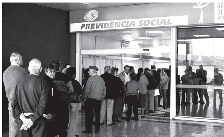
Regras orçamentárias impedem a emissão de títulos da dívida pública para pagamentos de salários e benefícios previdenciários

O crédito suplementar não irá resolver a base do problema, pois existem novas lacunas no orçamento que irão aparecer no decorrer dos anos.