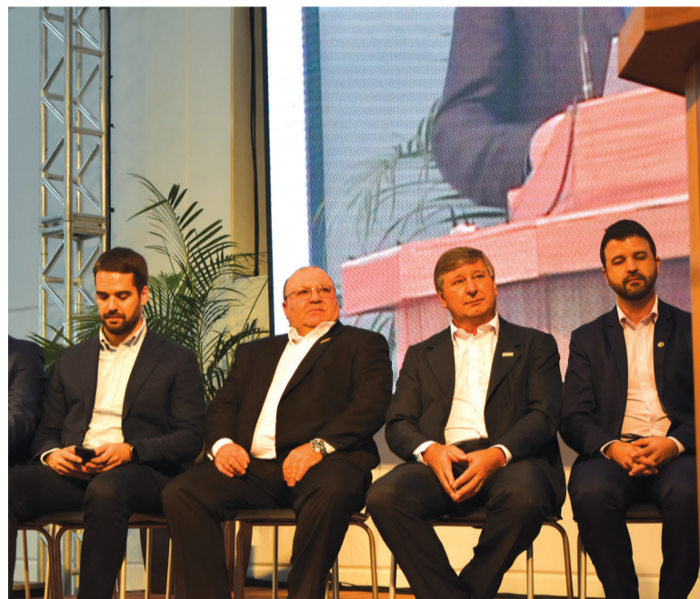
O Governador Eduardo Leite, chegou atrasado a solenidade, vindo de compromissos na cidade de Gramado

que nunca havia sido registrado em 88 anos de história. Lembrou também que emprega mais de 500 colaboradores e, junto com 1.100 famílias associadas, somam-se quase seis mil pessoas que vivem diretamente da