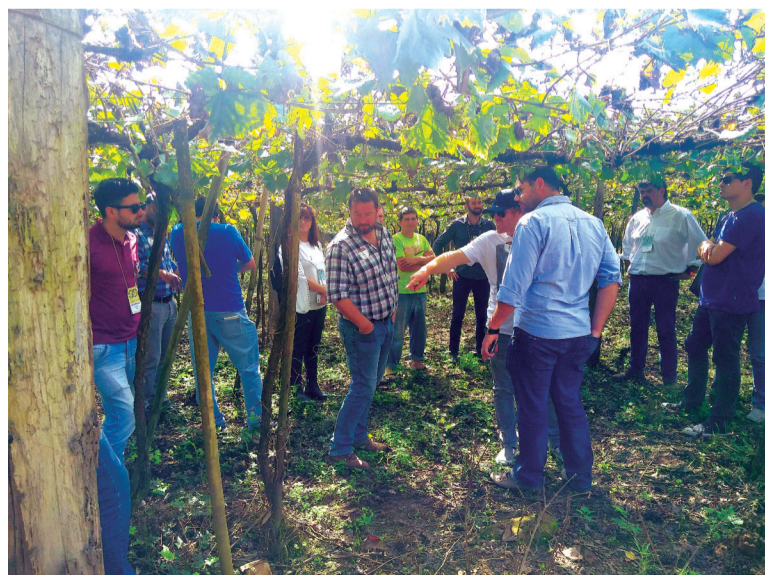
Técnicos e Agrônomos buscam por inovação e tecnologia para produção vitícola