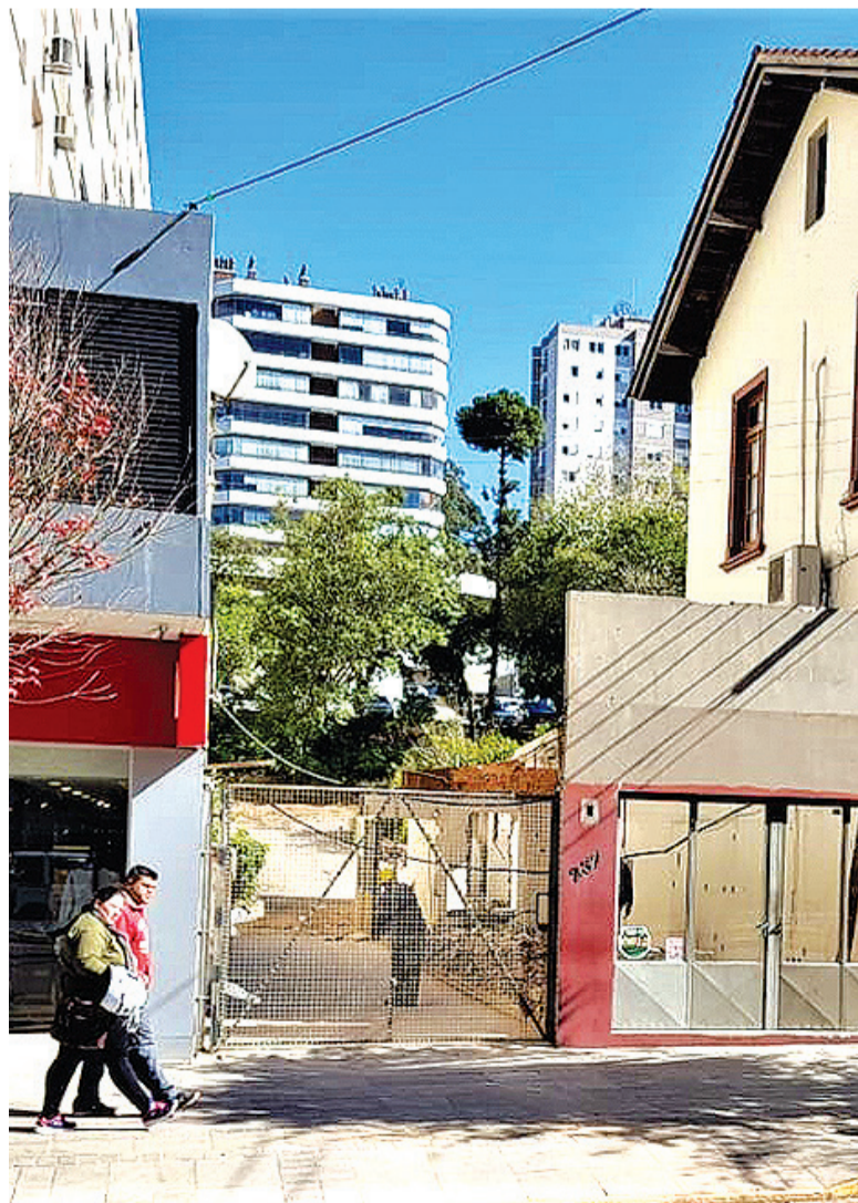
Obra foi interditada por falta de documentação