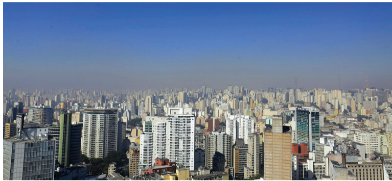
A poluição do ar mata cerca de 600 mil crianças todos os anos e causa sintomas que variam de perda de inteligência a obesidade e infecções de ouvido

“O ar poluído está envenenando milhões de crianças e arruinando suas vidas”, disse o diretor-geral da OMS, Tedros Adhanom Ghebreyesus, em um