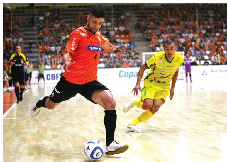
Com a derrota a ACBF se prepara para o primeiro jogo das semifinais da Liga Gaúcha