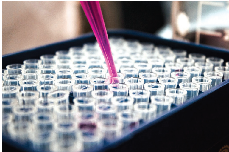
A endometriose afeta aproximadamente 10% das mulheres em idade reprodutiva no mundo, segundo o estudo da Northwestern. É uma das causas mais comuns para a infertilidade

“Existe um fator inflamatório que cria um ambiente hostil à implantação do embrião”, explica Padovesi. Ele destaca, no entanto, que a doença somente dificulta, mas não impede a gravidez. Entre os sintomas da doença estão cólica menstrual forte, dor na relação sexual, dor entre as menstruações, infertilidade, dor ao defecar ou ao urinar, sangramento na urina ou nas fezes.