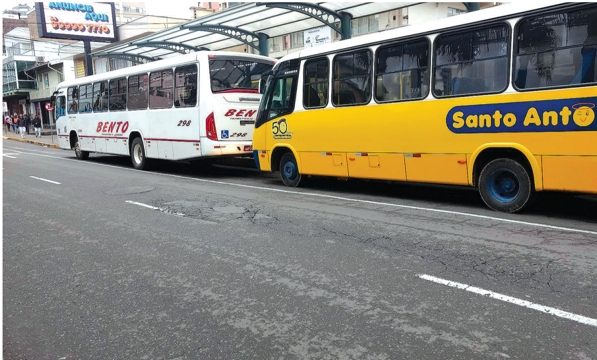
A tarifa para o serviço de transporte coletivo urbano passa de R$ 3,70 para R$ 3,90. No transporte seletivo, a tarifa sobe de R$ 4,46 para R$ 4,70. Os valores começam a ser praticados a partir desta quinta-feira, 15

Os valores das passagens do transporte coletivo e de táxi foram reajustados com base nos decretos nº 9.986 e 9.987 e entram em vigor nesta semana. Para o serviço de transporte individual de passageiros em veículo de aluguel providos de taxímetro (TÁXI), ficam fixados os seguintes valores: Bandeirada de R$ 5,07 para R$ 5,74, Bandeira 1 R$ 2,93 para R$ 3,32, Bandeira 2 R$ 3,51 para R$ 3,97, A hora táxi foi reajustada R$ 21,78 para R$ 24,65. Nas corridas em que houver o transporte