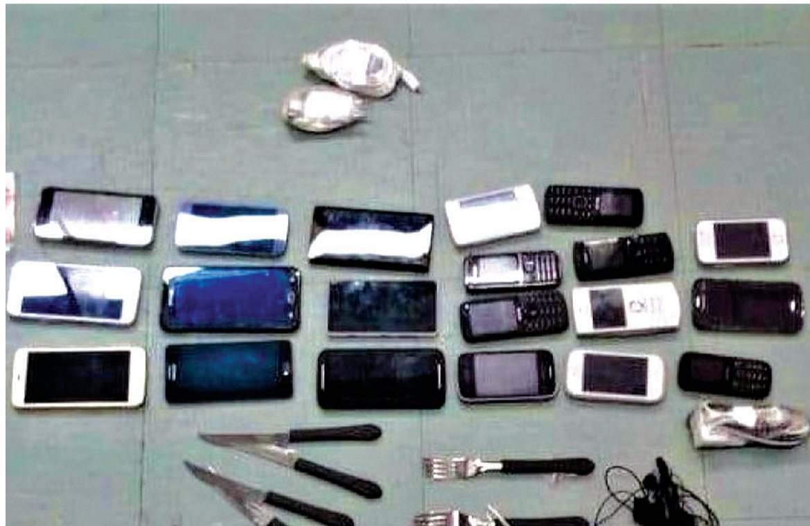
Antes que os presos conseguissem pegar os objetos, os agentes penitenciários conseguiram interceptar a ação e apreender o material

acompanhavam a movimentação na área externa pelas câmeras de videomonitoramento. Dois homens foram detidos na área externa da casa de detenção. Os dois suspeitos foram encaminhados à Delegacia de Polícia de Pronto Atendimento (DPPA) para registro de ocorrência policial. Após prestarem depoimento, eles foram liberados. Os nomes dos acusados não foram divulgados.