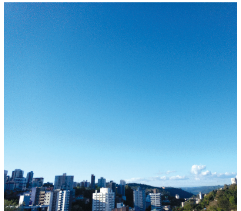
A chuva deve voltar, porém em menor intensidade, na quinta-feira, 18, quando deve ter 10 mm, já na sexta a expectativa é de 8 mm

xo de ar quente e úmido tropical avançam com nuvens muito carregadas pelo interior da Região. O risco de temporais aumenta novamente, sobretudo em cidades do oeste e noroeste gaúchos, oeste catarinense e sudoeste e oeste paranaenses. A previsão é que a semana termine com chuva forte e nova queda de temperatura em muitas áreas entre o norte do RS e o PR por conta da entrada de uma nova frente fria acompanhada por uma massa de ar polar moderada.