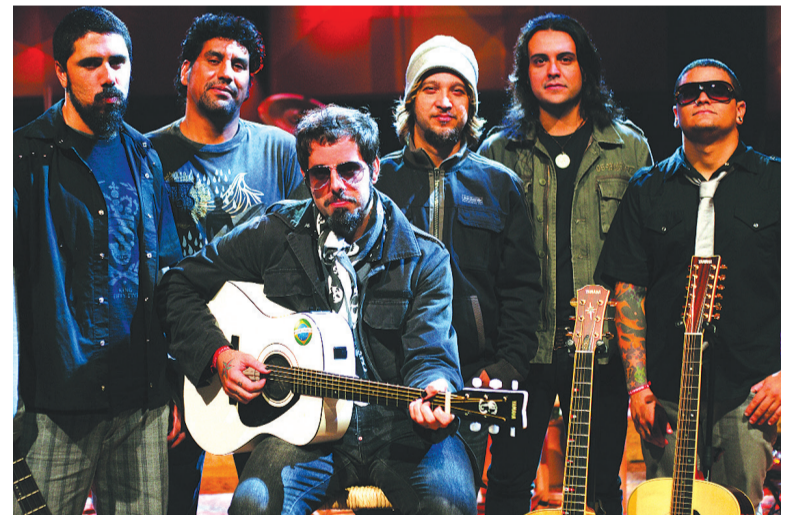
Detonautas é uma das atrações confirmadas