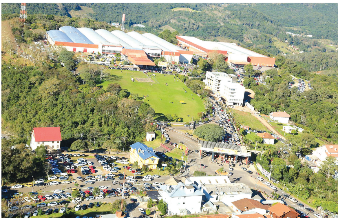
Estrutura da Fundaparque é destaque pela versatilidade

O Parque de Eventos de Bento Gonçalves é um dos maiores complexos cobertos da América Latina, com 58 mil m 2 . Os seis pavilhões e os mais de 320 mil m 2 possuem inúmeras facilidades como torre de telefonia, internet, cobertura wireless, heliponto, reservatórios de água, estacionamento asfaltado – permitindo um fluxo de 2.500 automóveis dentro do complexo, e três subestações – totalizando 10 mil kW de potência. Além disso, um dos pavilhões pode ser transformado em auditório para duas mil pessoas; abrigar quatro salas para 450 convidados; ou, ainda, apresentar seis subdivisões para 220 lugares cada – e outras montagens similares, de acordo com a necessidade. A Fundaparque fica localizada na Alameda Fenavinho, 481, bairro Fenavinho, em Bento Gonçalves – RS.