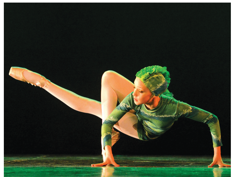
Do palco do Bento em Dança, centenas de bailarinos já emigraram para outros festivais ou cursos como bolsistas