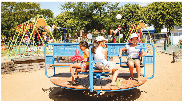
O conjunto balanços, gangorras, carrossel e casinhas é exclusivo no mundo, desenhado voluntariamente por designers de Bento Gonçalves