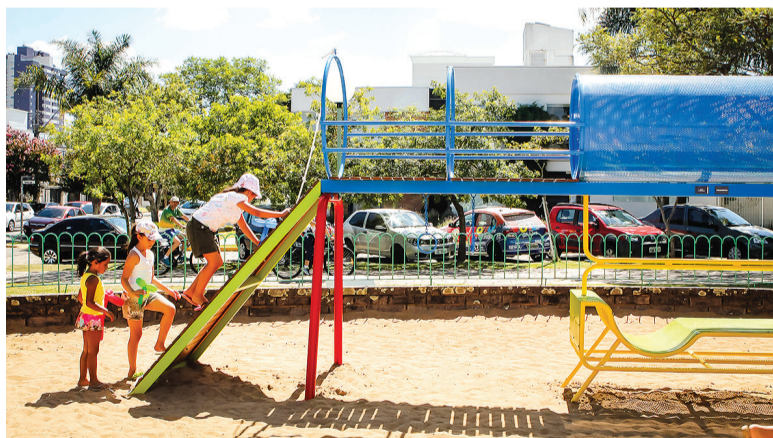
O parquinho foi uma doação da entidade à comunidade local em 2016, durante o projeto Somos Móveis, realizado para as comemorações das 20 edições da feira Movelsul Brasil