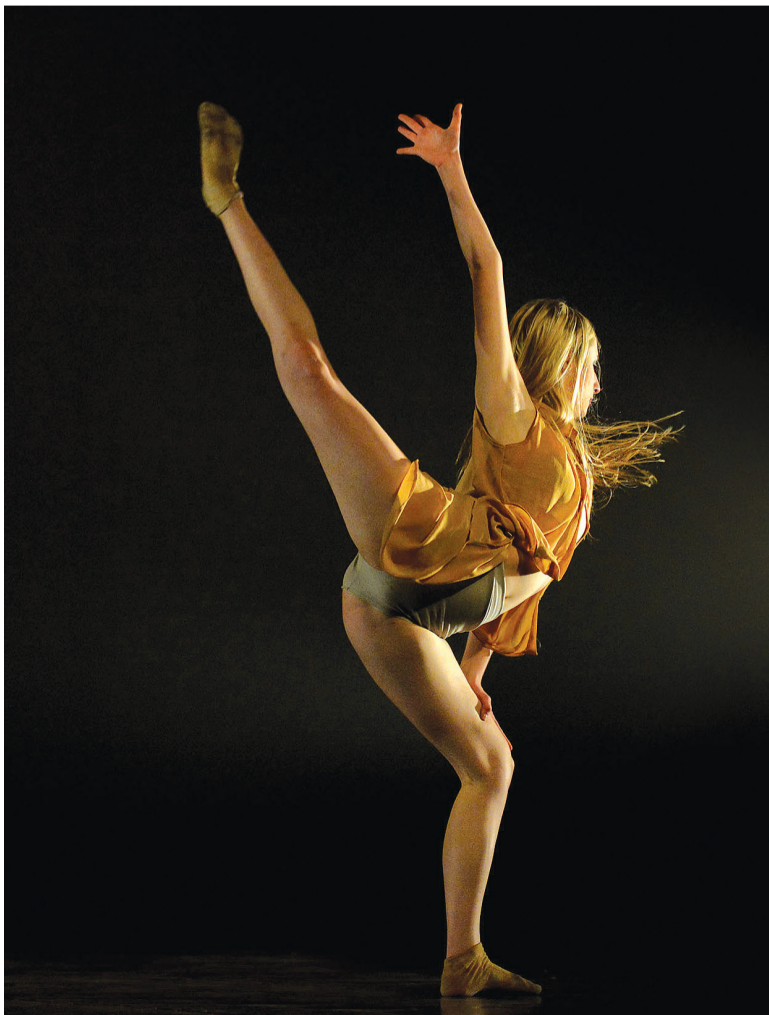
Gala de Encerramento mesclou destaques de todo o festival em diferentes gêneros da dança