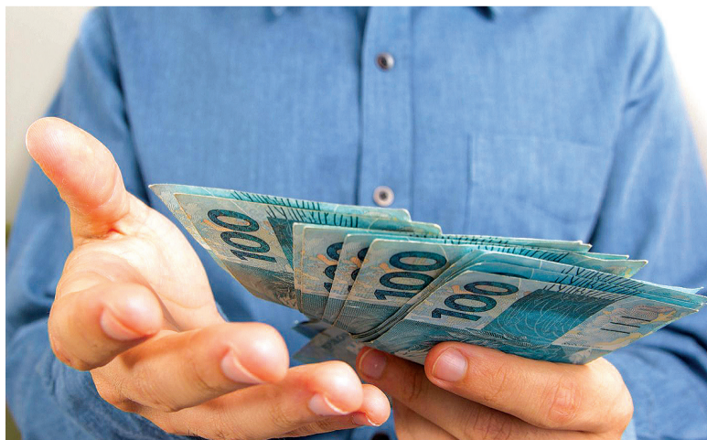
A Receita Federal pagou nesta segunda-feira, 15, o quinto lote de restituição do Imposto de Renda 2018. O lote também inclui restituições residuais de 2008 a 2017

É possível retificar a declaração do Imposto de Renda a qualquer momento.