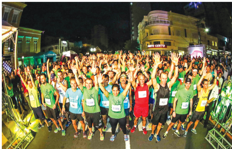
A Sparkling Night Run 2018 acontece na noite de 10 de novembro, em Bento Gonçalves

As inscrições ainda podem ser confirmadas pelo valor de R$ 120,00 – dando direito a um número de peito e chip; camiseta de manga curta; sacola personalizada; tickets para degustação de espumantes e massas; uma