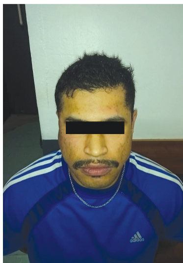
Juntamente com o material estava a carteira de identidade do abordado. Diante dos fatos, o indivíduo foi preso

Na noite de sexta-feira, 12, durante a Operação Dissolutio, uma guarnição da PATRES – Patrulhas Especiais, durante deslocamento pelo endereço citado visualizou um indivíduo em via pública onde este ao perceber a presença dos policiais fugiu, correndo em direção a uma residência, sendo acompanhado e abordado no interior da casa. Ao averiguar o local, os policiais localizaram, em uma sacola sobre um móvel, 03 pedras de crack, pesando 13,6 gramas, uma pedra de cocaína pesando 103 gramas, uma balança de precisão e um celular. Juntamente com o material estava a carteira de identidade do abordado. Diante dos fatos, o indivíduo foi preso.