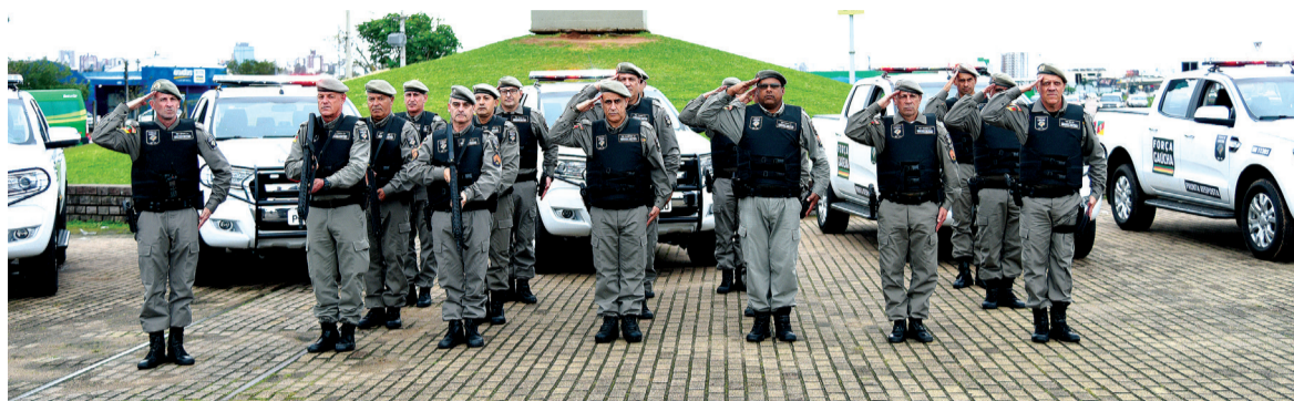
A tropa é formada por militares estaduais e por servidores da ativa das carreiras da segurança pública ou por inativos e aposentados designados