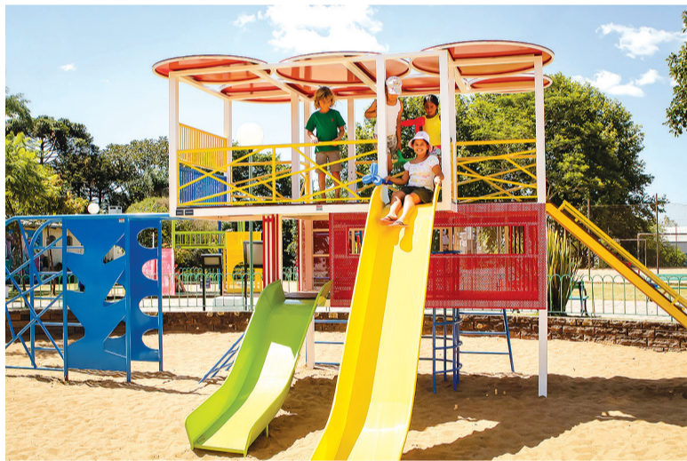
As obras deverão durar duas semanas e seguem conforme condições climáticas

Os brinquedos são assinados pelos estúdios Bria Design, Eduardo Nuncio, Intervento Design, Studio Marta Manente, Projeto 3 e UNT Design. O projeto segue as normas vigentes de fabricação e conta com o suporte de um arquiteto responsável.