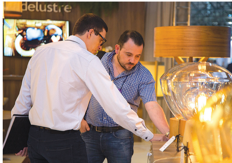
Promovida pelo Sindmóveis Bento Gonçalves desde 1977, a Movelsul Brasil é a maior plataforma de negócios da América Latina para o setor moveleiro

Em sua história, a Movelsul Brasil já teve mais de 1.700 empresas expositoras. A primeira edição da feira aconteceu em 1977, ano em que o setor moveleiro consolidou-se como atividade líder na economia de Bento Gonçalves. A 1ª Mostra do Mobiliário de Bento Gonçalves reuniu 24 fabricantes de móveis da