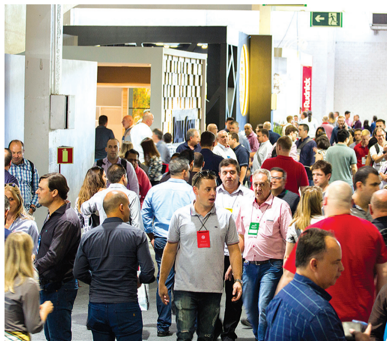
A última edição da feira, em março desse ano, teve 30.284 visitantes profissionais de 33 países