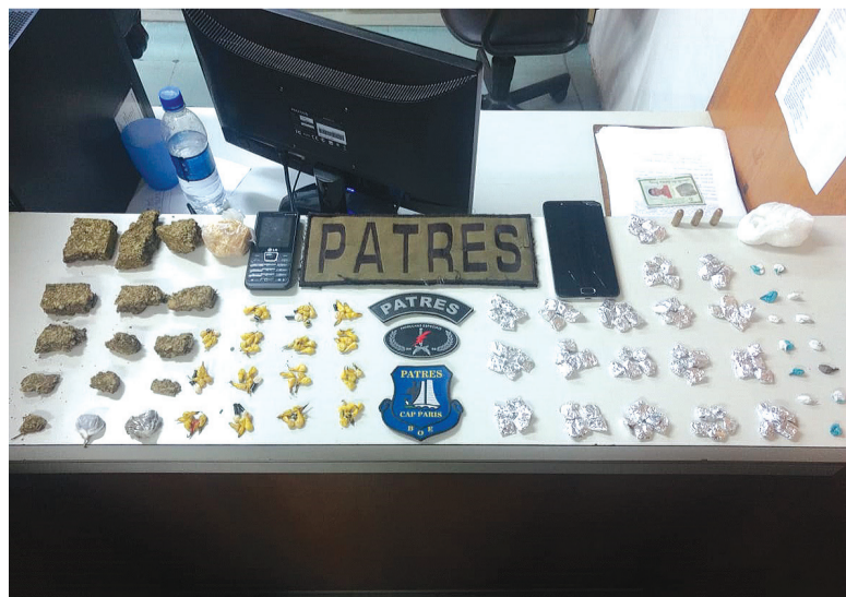
Diante dos fatos, ambos foram apreendidos e conduzidos até a DPPA para registro

cocaína, três munições de calibre 380 e um celular. Na pochete do menor A.M.B.S de 17 anos, foram localizadas 74 pedras de crack, 15 tijolos pequenos de maconha, uma pedra grande de crack e um celular. Diante dos fatos, ambos foram apreendidos e conduzidos até a DPPA para registro. É a 3º vez que o menor A.M.B.S é apreendido pelo crime de tráfico de drogas nos últimos 20 dias.