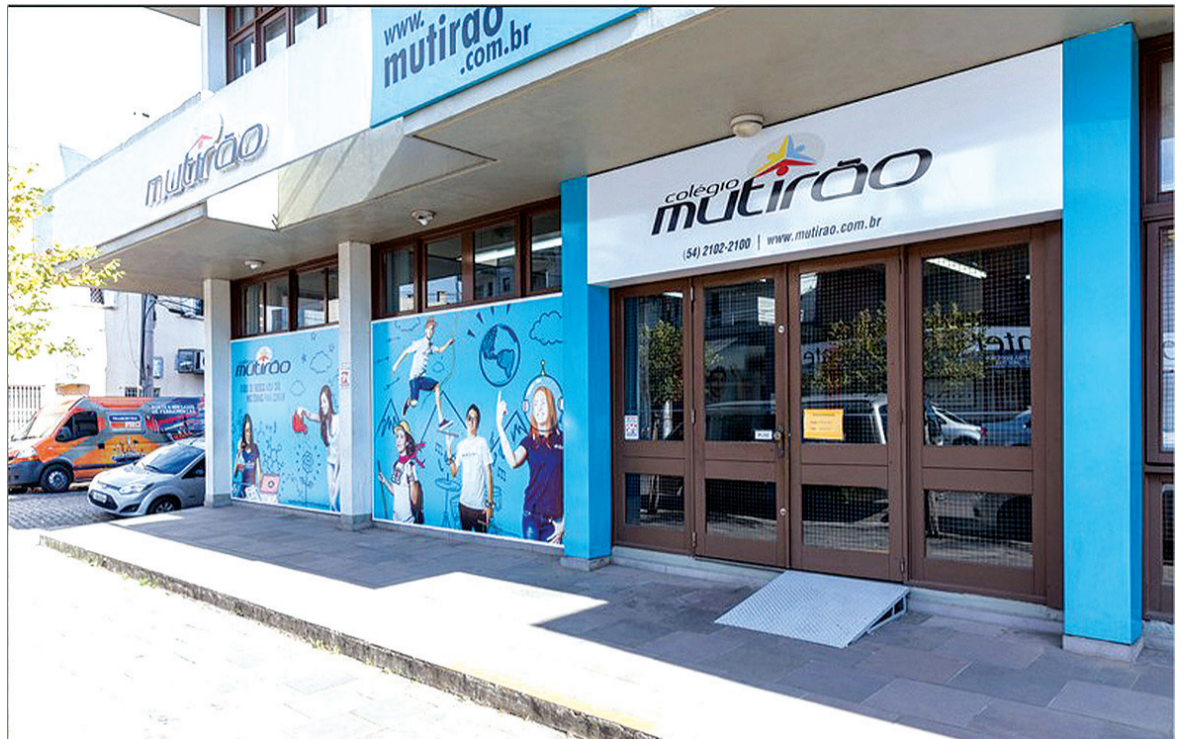
Colégio Mutirão tem 38 anos de história e há 20 anos chegou em Bento Gonçalves

“Em 2010 o pré-vestibular deixou de existir aqui e queremos resgatar o 3º ano com o pré-vestibular. O aluno fazia o