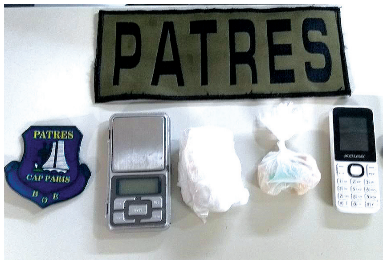
Ao averiguar o local, os policiais localizaram, em uma sacola sobre um móvel, 03 pedras de crack, pesando 13,6 gramas, uma pedra de cocaína pesando 103 gramas, uma balança de precisão e um celular