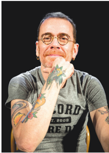
Show de Nando Reis é um dos destaques da agenda de novembro

O Parque de Eventos de Bento Gonçalves é um dos maiores complexos cobertos da América Latina, com 58 mil m 2 . Os seis pavilhões e os mais de 320 mil m 2 possuem inúmeras facilidades como torre de telefonia, internet, cobertura wireless, heliponto, reservatórios de água, estacionamento asfaltado – permitindo um fluxo de 2.500 automóveis dentro do complexo, e três subestações – totalizando 10 mil kW de potência. Além disso, um dos pavilhões pode ser transformado em auditório para duas mil pessoas; abrigar quatro salas para 450 convidados; ou, ainda, apresentar seis subdivisões para 220 lugares cada – e outras montagens similares, de acordo com a necessidade. A Fundaparque fica localizada na Alameda Fenavinho, 481, bairro Fenavinho, em Bento Gonçalves – RS.