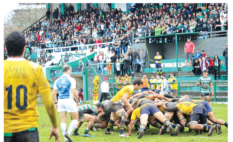
Paulistas venceram o Farrapos pelo placar de 30 a 25

O Farrapos agora direciona o foco para as próximas competições estaduais com a modalidade de Sevens, com o Campeonato Gaúcho de Rugby Sevens, que acontece em etapa única, em Bento Gonçalves. Além do adulto, as categorias Juvenil e Feminino também dão sequência às suas participações nas competições estaduais na modalidade olímpica do rugby.