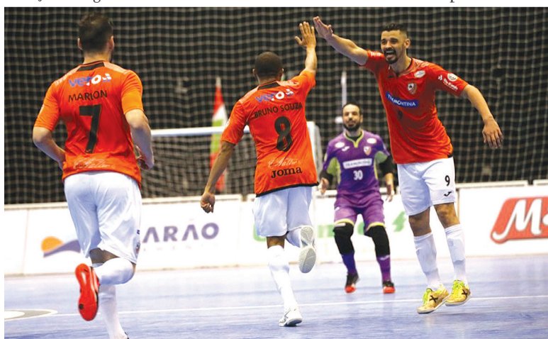
O time laranja enfrentou o Tubarão, em Santa Catarina, e venceu por 6x4

Com a vitória a ACBF terá a vantagem de jogar por um empate na segunda partida das oitavas, que será no dia 21, em Carlos Barbosa