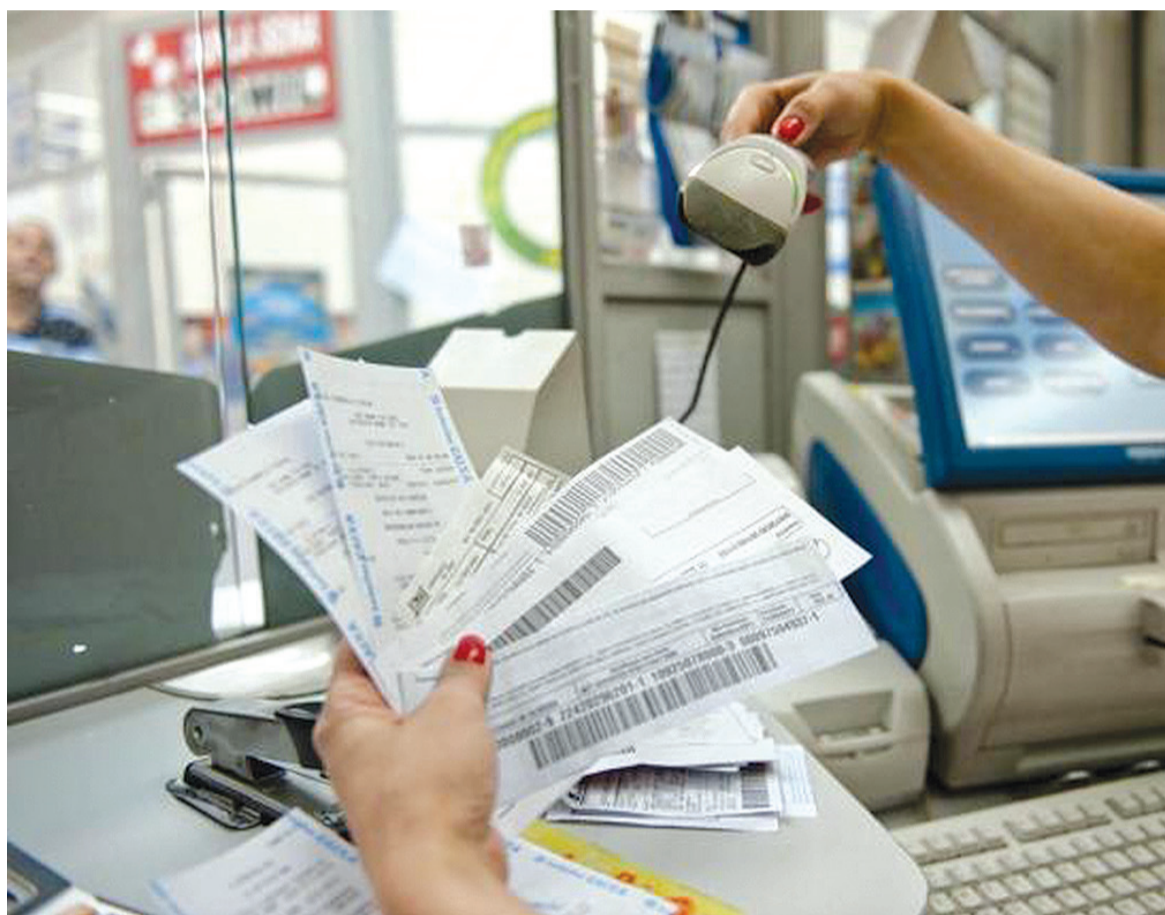
Desde o último sábado, 13, os boletos com valor a partir de R$100, mesmo vencidos, poderão ser pagos em qualquer banco