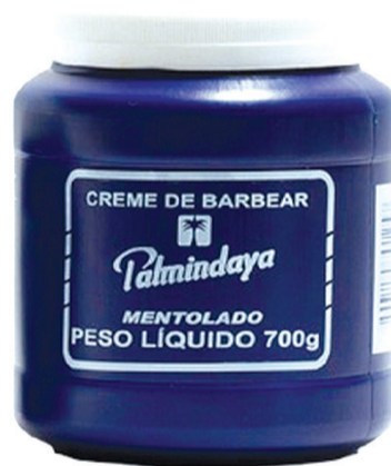
Lote do creme de barbear Palmindaya apresentou alteração da faixa de pH

Desodorante Creme Hidratante Mãos e Pés Essência Flor de Laranjeira Palmindaya, lote 011, fabricado em 16 de junho de 2017