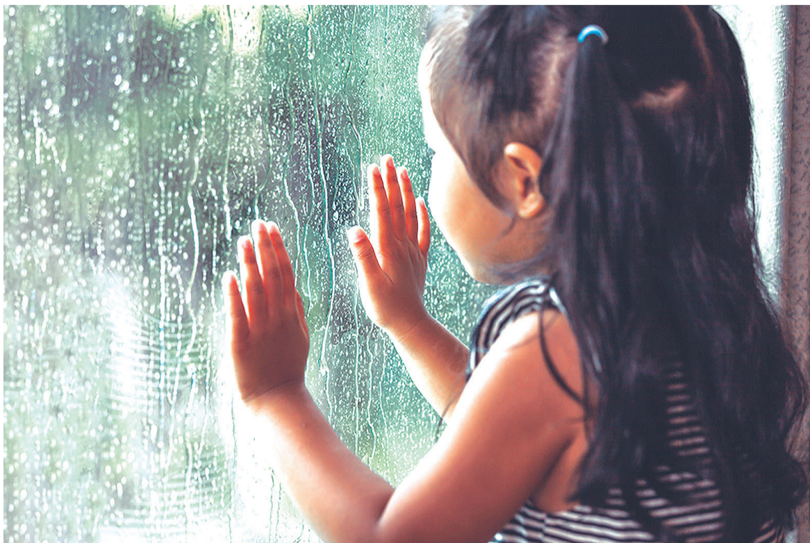
Os pesquisadores avaliaram até que ponto a mãe tentou assumir a tarefa ou deixou que o filho descobrisse sozinho como funcionava uma atividade

- Evitam as discussões. Não gostam de molestar a ninguém. Fogem de situações de conflito.