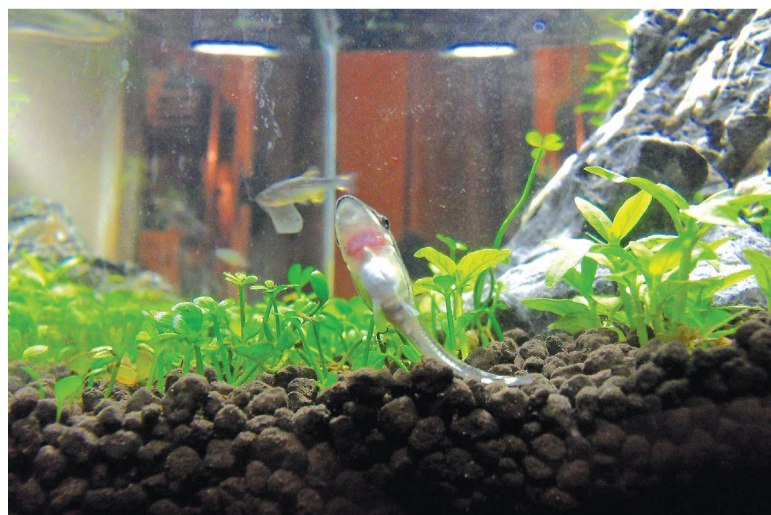
A recomendação é trocar 20% da água, que será suficiente para renovar o oxigênio do tanque

Teste a água novamente e, se necessário, use um neutralizador de substâncias para restabelecer o PH da água.