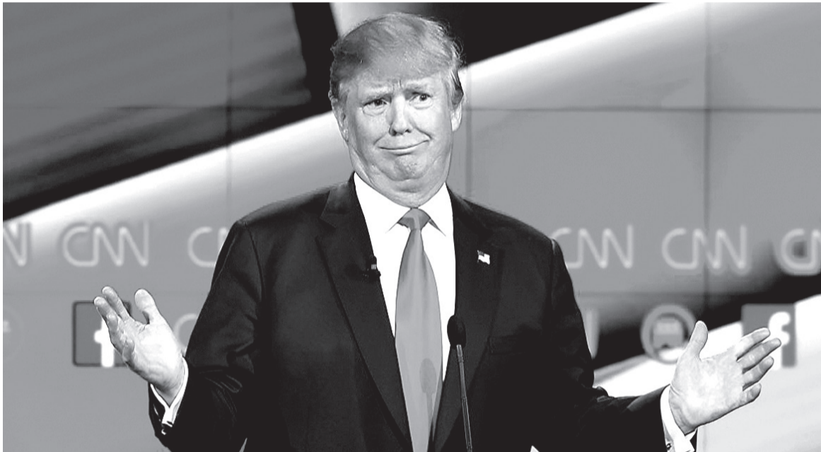
O estudo foi realizado pela empresa de relações públicas Burson Cohn & Wikf (BCW). Foi avaliado o período entre 19 de maio de 2017 e 18 de maio

Apenas os governos de Laos, Mauritânia, Nicarágua, Coreia do Norte, Turquemenistão e Suazilândia não têm representação oficial na rede social.