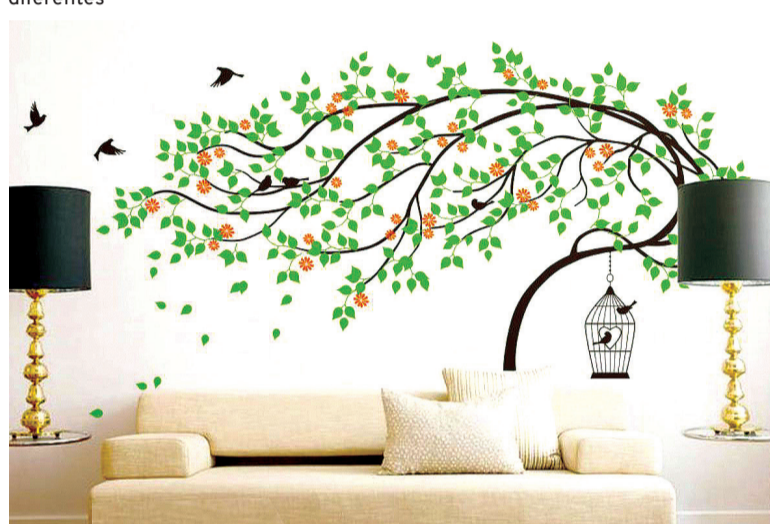
A aplicação do papel de parede é simples e rápida