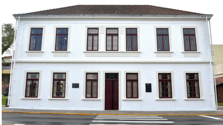
Mostra segue até agosto no Museu do Imigrante

tilhos, de Porto Alegre, também participará da exposição compartilhada expondo aspectos relacionados ao vinho, massa e polenta formando um cenário que restaura a relação do homem com os alimentos. A exposição segue até o dia 14 de agosto.