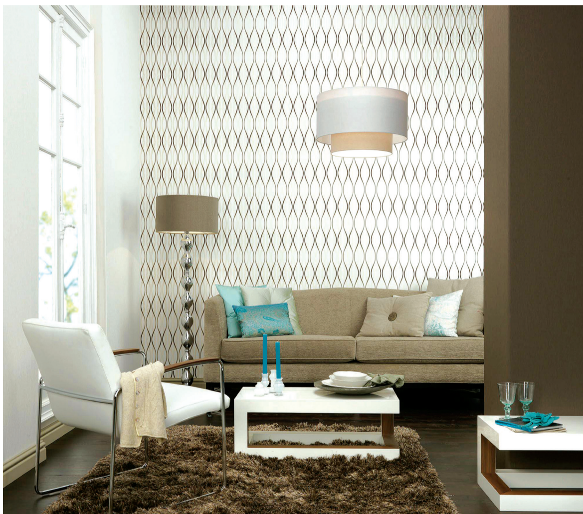
Os papéis de parede não são indicados para áreas externas ou molhadas