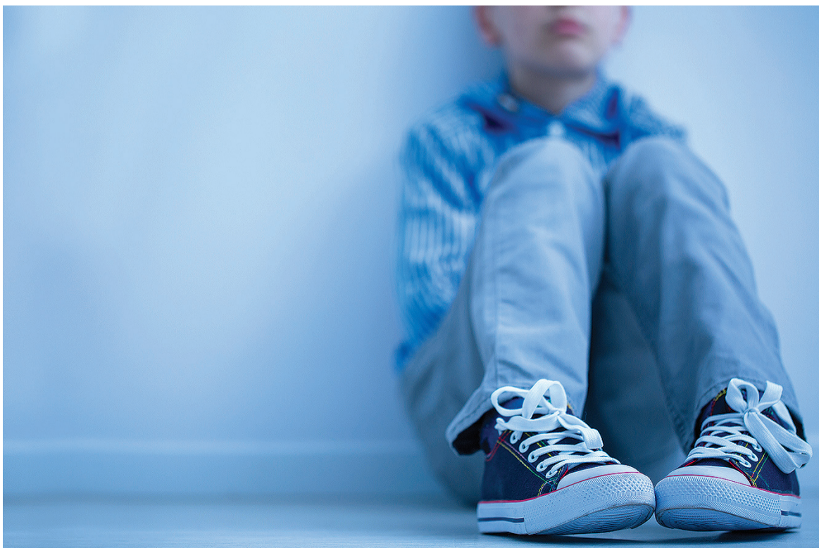
Alguns pontos foram levados em conta, como a personalidade individual e status socioeconômico das crianças pesquisadas

A Mãe American Express é o tipo que não deixa seus filhos crescerem e se afastarem, literalmente ou psicologicamente; ela impõe metaforicamente o antigo lema da American Express, “não saia de casa sem ele”. Ela tenta manter o relacionamento mãe-