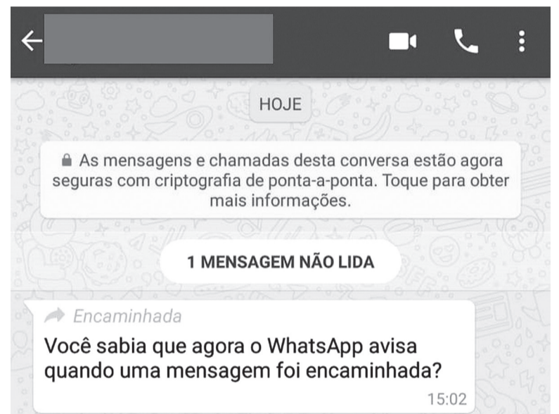
Whatsapp passa a avisar o usuário se a mensagem recebida foi encaminhada de outra conversa

De acordo com a assessoria de imprensa do aplicativo, o recurso está sendo liberado gradativamente para 100% da base de usuários, entre usuários beta e regulares. Em nota, a empresa disse que “para visualizar a nova etiqueta de ‘encaminhada’, é necessário ter a atualização mais recente do WhatsApp no seu telefone.”