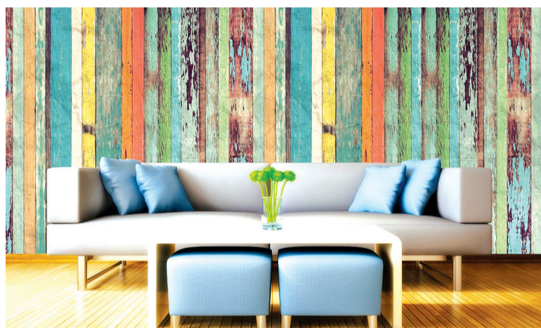
Além das estampas, as texturas são outro ponto positivo deste material