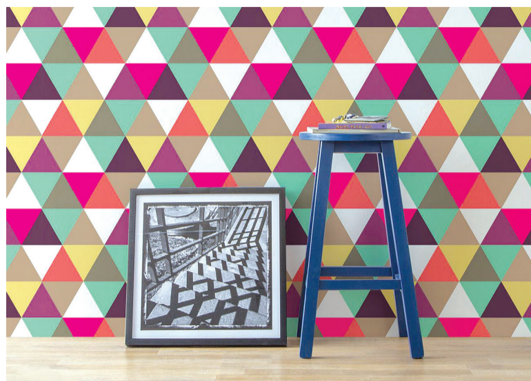
Uma boa estampa leva personalidade ao ambiente e pode ajudar a criar climas diferentes

A aplicação do papel de parede é simples e rápida - não provoca respingos e odores, que podem vir com a pintura, por exemplo. Quem tem um pouco de habilidade manual e disposição pode aplicar o papel em casa até sem a ajuda de profissionais.