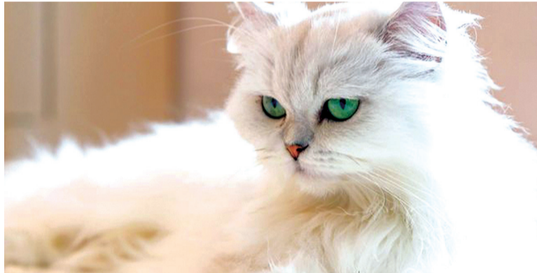
O gato Persa é extremamente calmo e paciente, sendo perfeito para crianças que curtem brincar com o animal

Uma das maiores vantagens de escolher o American Shorthair é por causa da sua adaptabilidade. Ele se encaixa em qualquer tipo de família, desde casas grandes com muitos filhos até alguém que vive sozinho numa residência pequena. É por isso que está na lista de raças indicadas para crianças. Seu perfil bem humorado e tranquilo combina muito com os pequenos. Além disso, é um bichano muito inteligente, que está atento a tudo