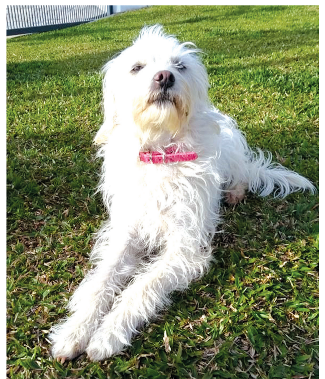
A pequena Emily faz pose para foto