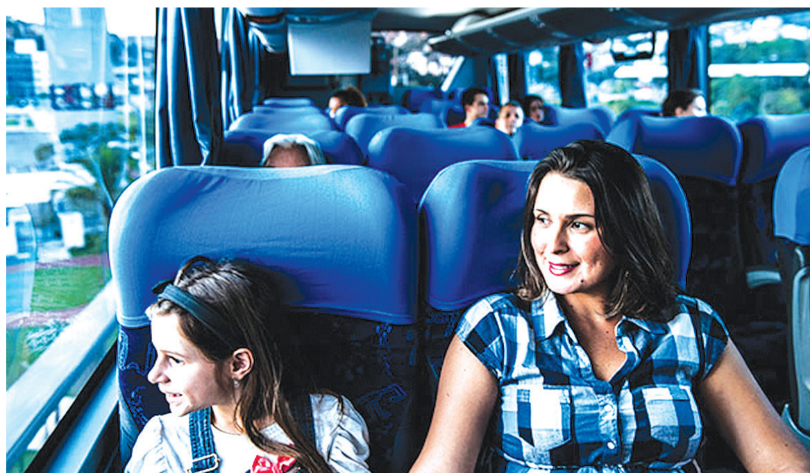
Para garantir uma viagem tranquila é importante pensar em alternativas para manter os pequenos distraídos no ônibus, em especial nos trechos muito longo