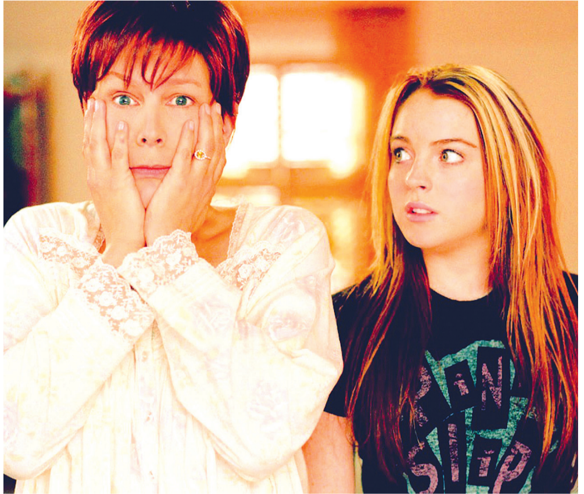
Os autores identificaram seis tipos de relacionamentos mãe-filho pouco saudáveis

Os autores identificaram seis tipos de relacionamentos mãe-filho pouco saudáveis. Aqui estão eles: