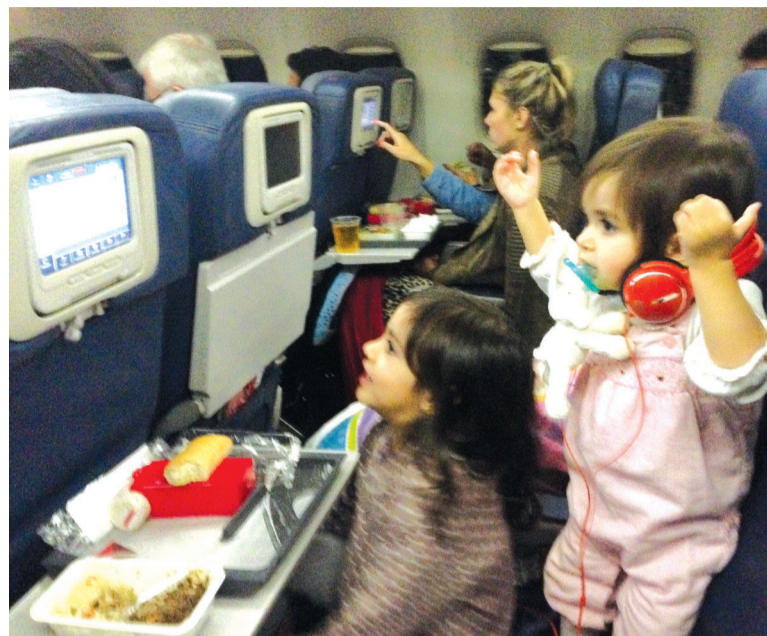
Viagens de avião não são recomendadas para bebês menores de dois meses. Assim como o ônibus, há formas de distrair os pequenos durante o trajeto

Crianças de até seis meses podem ser levadas no colo dos pais dentro de ônibus rodoviários. Há quem prefira o canguru ou sling para levar crianças muito pequenas, pois isso deixa livre os braços de quem as carrega, proporcionando mais conforto. O cinto de segurança deve ser afivelado apenas no adulto. Crianças maiores podem usar o bebê conforto ou cadeirinhas para automóveis, mas é aconselhável ver essa possibilidade previamente com a sua empresa de ônibus. Também nunca deixe a criança sozinha no ônibus, nem durante paradas no caminho, enquanto ela estiver dormindo. Sempre leve o seu pequeno com você. A criança é de responsabilidade total do pai ou responsável.