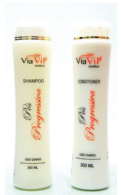
Viavip Cosméticos Ltda teve todos os seus produtos de beleza suspensos