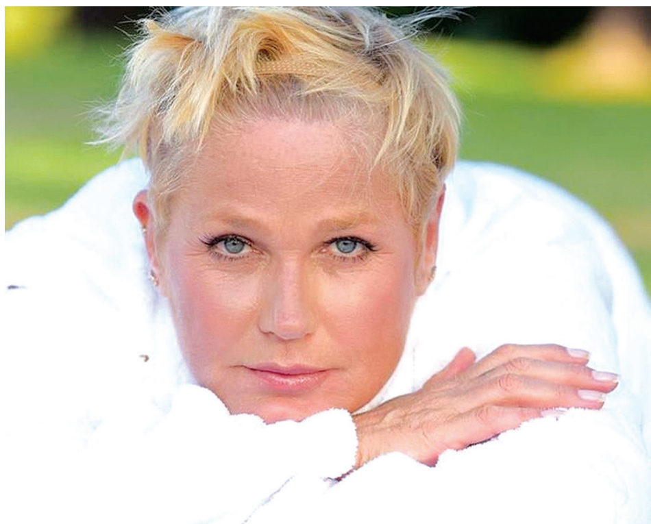
O processo foi julgado em segunda instância e encerrado no final de junho

Em outubro passado, a apresentadora fez um vídeo para os fãs em que falou um pouco sobre o assunto. “Não gosta de mim, não tem problema. Ótimo, não quero que gostem de mim. Querem me chamar de garota de programa, querem me chamar de pedófila porque fiz um filme quando tinha 18 anos, chamem. Aliás, eu gostaria que todo mundo visse o filme, por favor. É muito bom. Querem me chamar de prostituta, chamem, mas existe uma lei chamada Menino Bernardo, que vocês vão ter de aceitar. E essa lei é clara, não pode usar violência contra criança”, declarou ela na publicação.