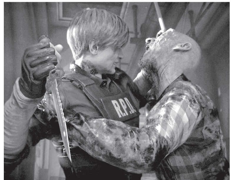
“Resident Evil 2” também tem um recurso que mostra os ferimentos causados em tempo real e de maneira realista

O “remake” de “Resident Evil 2” será lançado em 25 de janeiro de 2019 para Xbox One, PS4 e PCs.