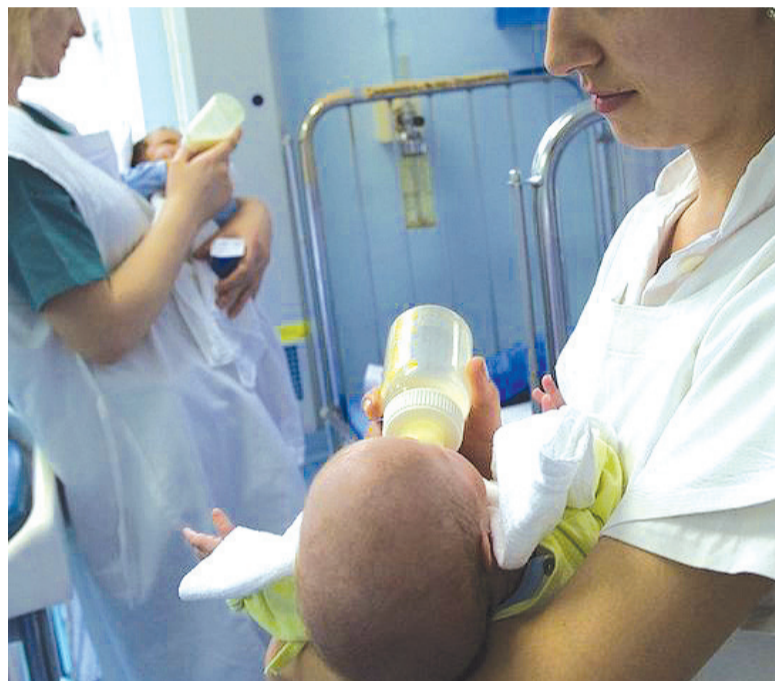
Governo americano pediu para os outros países limitarem o marketing impreciso ou enganoso de métodos substitutos à amamentação

governos limitem o marketing impreciso ou enganoso de métodos substitutos à amamentação. O tradicional periódico do país mostrou o posicionamento contrário do governo americano no que diz respeito ao incentivo à amamentação, de forma a favorecer os interesses dos fabricantes de fórmulas infantis. O Departamento de Estado se recusou a comentar dizendo que não poderia comentar as discussões diplomáticas privadas.