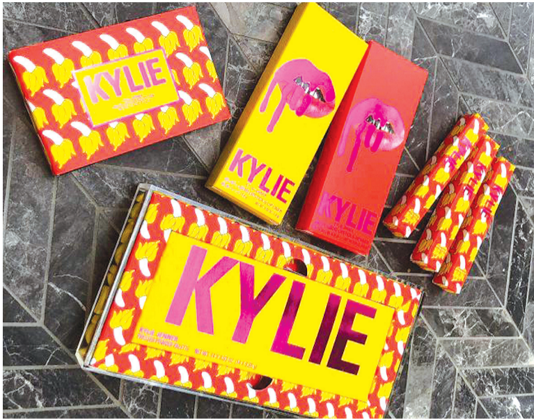
Embalagens foram criadas especialmente para a estação

preenchimento labial”. Na última semana, Kylie chegou a brincar num vídeo que sua filha, Stormi, não puxou os lábios grossos dela, mas do pai, Travis Scott.