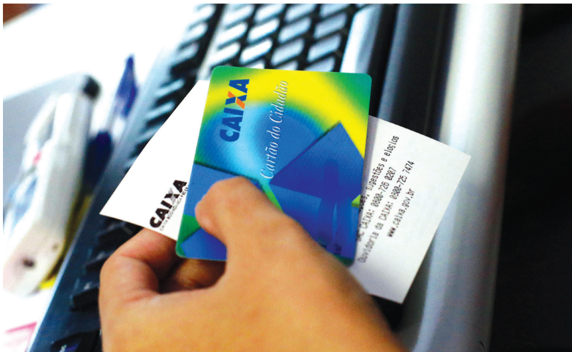
Para ter direito ao abono salarial do PIS/Pasep, é necessário ter trabalhado formalmente por pelo menos um mês em 2017 com remuneração média de até dois salários mínimos

Os valores do PIS-Pasep estarão disponíveis, corrigidos, a partir de 8 de agosto para clientes da Caixa e do Banco do Brasil. E de 14 de agosto a 28 de setembro para os beneficiários que não são clientes dos dois bancos públicos. A partir de 29 de setembro, só é possível receber quantias dos dois fundos nos casos previstos na Lei 13.677/2018.