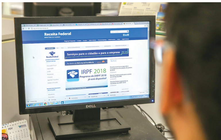
Para saber se teve a declaração liberada, o contribuinte deve acessar a página da Receita na internet, ou ligar para o Receitafone, número 146

A restituição ficará disponível no banco durante um ano. Se o contribuinte não fizer o resgate nesse prazo, deverá fazer requerimento por meio da internet, mediante o Formulário Eletrônico - Pedido de Pagamento de Restituição, ou diretamente no e-CAC, no serviço Extrato do Processamento da DIRPF.