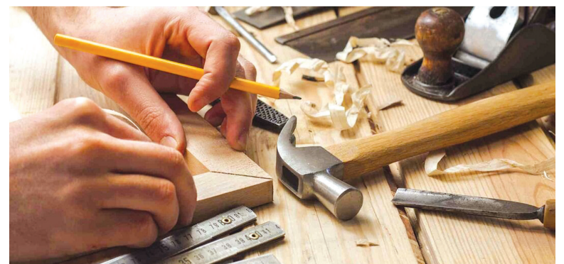
Há vaga para marceneiro nesta semana

Os interessados devem comparecer na agência, na Rua Marechal Floriano, 142, a partir das 8h. Mais informações através dos telefones (54) 3451-5822 / 3452-4824.