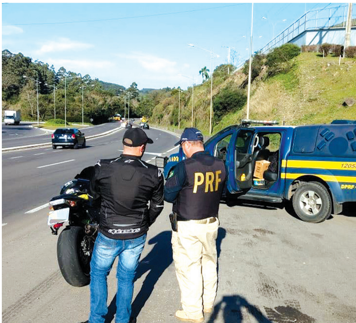
Em três finais de semana, já foram contabilizadas 36 autuações e 4 prisões