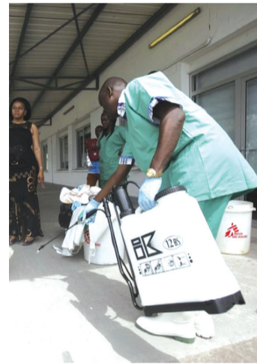
O pesquisador apontou que a equipe espera ter resultados dos testes realizados com ratos em um ano

Segundo ele, esta técnica que consiste em buscar a melhor forma de atacar os pontos vulneráveis dos vírus poderia dar pistas para combater outras doenças, como o HIV e a gripe.