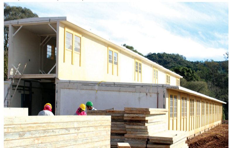
Obra deverá ser entregue no final de janeiro