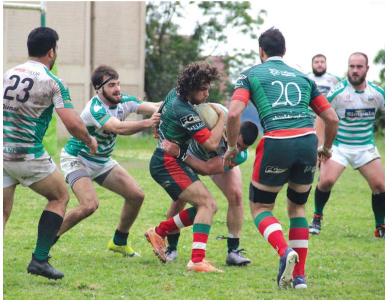
A equipe bento-gonçalvese está no grupo D do Campeonato Brasileiro de Rugby, ao lado do Charrua-RS, San Diego-RS e do Desterro-SC

para casa, estar com meus amigos de onde eu comecei a jogar rugby. A minha ansiedade é de poder entrar na Montanha com eles, jogar com a camisa do Farrapos e na frente da minha família depois de alguns anos. Vou fazer meu melhor pra poder somar dentro do clube e principalmente passar momentos ótimos com o Farrapos outra vez”, ressalta o atleta.