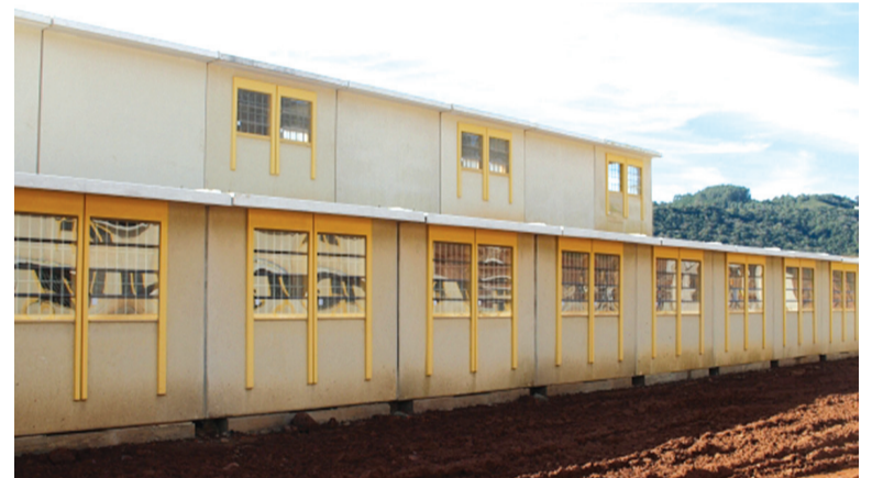
Novo presídio terá capacidade para 420 detentos

A área onde está sendo erguido o presídio possui 5.616,80 metros quadrados, na Estrada do Barracão. O terreno foi dado ao Estado pela Prefeitura. Pelo contrato, o investimento é de R$ 30.892.312,74. O imóvel do Daer, permutado à Verdi, é de R$ 19,1 milhões. A diferença (R$ 11.792.312,74) será paga com recursos provenientes do Fundo Estadual de Gestão Patrimonial (Fegep).