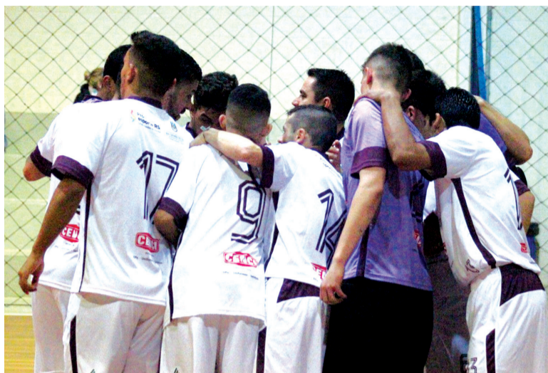
O BGF realizou uma grande atuação no primeiro tempo de jogo, sendo sólido defensivamente e aproveitando os contra-ataques para finalizar a gol