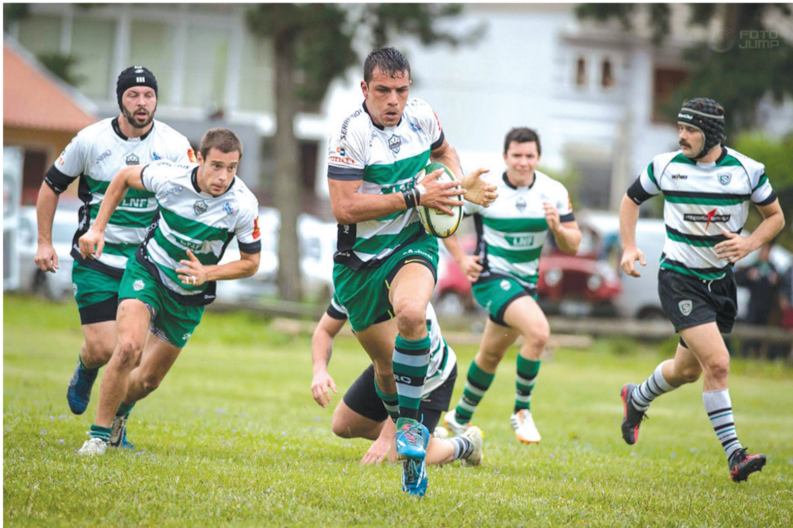
O Farrapos, atual vice-campeão do Super 8, se prepara para mais uma edição da competição nacional de Rugby

01/09 - Charrua x Farrapos - Porto Alegre