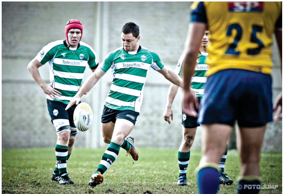
O Farrapos estreia no Super 16 no dia 21 de julho, às 15h, contra a equipe do Charrua de Porto Alegre, no Estádio da Montanha