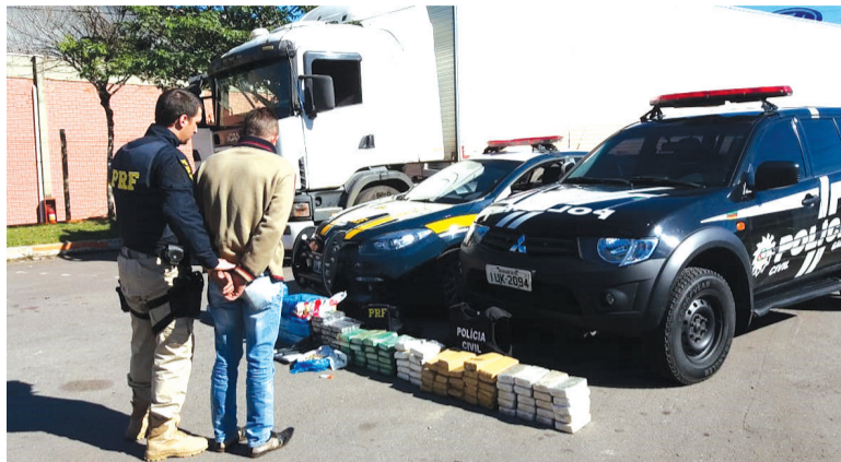
Homem que conduzia a carreta foi preso pelo crime de tráfico internacional de drogas e de armas.

Após abordagem e ao procederem a revista ao veículo, os policiais encontraram 20,8 kg de pasta base de cocaína, 52,5 kg de cocaína e 111 Kg de maconha. Cada kg de pasta base pode virar 10 kg de cocaína, ou