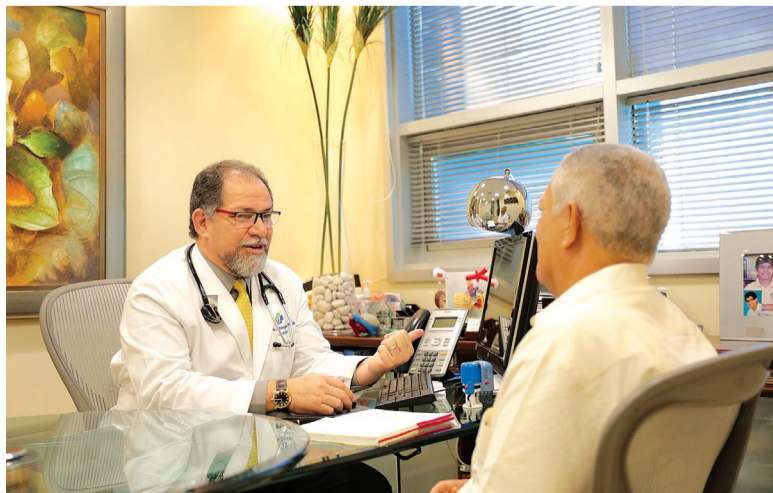
Performance masculina na cama pode ser um bom indicador da saúde das artérias e do coração

"O homem mais velho vem de uma geração sem costume de usar preservativo. Como normalmente tem problemas em manter a ereção, descarta sua utilização. A falta de diálogo e de campanhas sobre doenças sexualmente transmissíveis dificulta a prevenção e, inclusive, o diagnóstico. Não basta perguntar se o idoso é casado ou viúvo, como se o estado civil determinasse sua atividade sexual. É preciso ir além para saber se tem alguém com quem mantenha relações sexuais, ou se as relações são com uma pessoa do mesmo sexo", afirmou a geriatra.