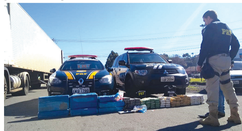
Contando com o processo da transformação da pasta base em cocaína, droga apreendida chega a mais de 300 g

seja, os pouco mais de 20 kg de base de cocaína da droga resultariam em mais de 200 kg da droga.