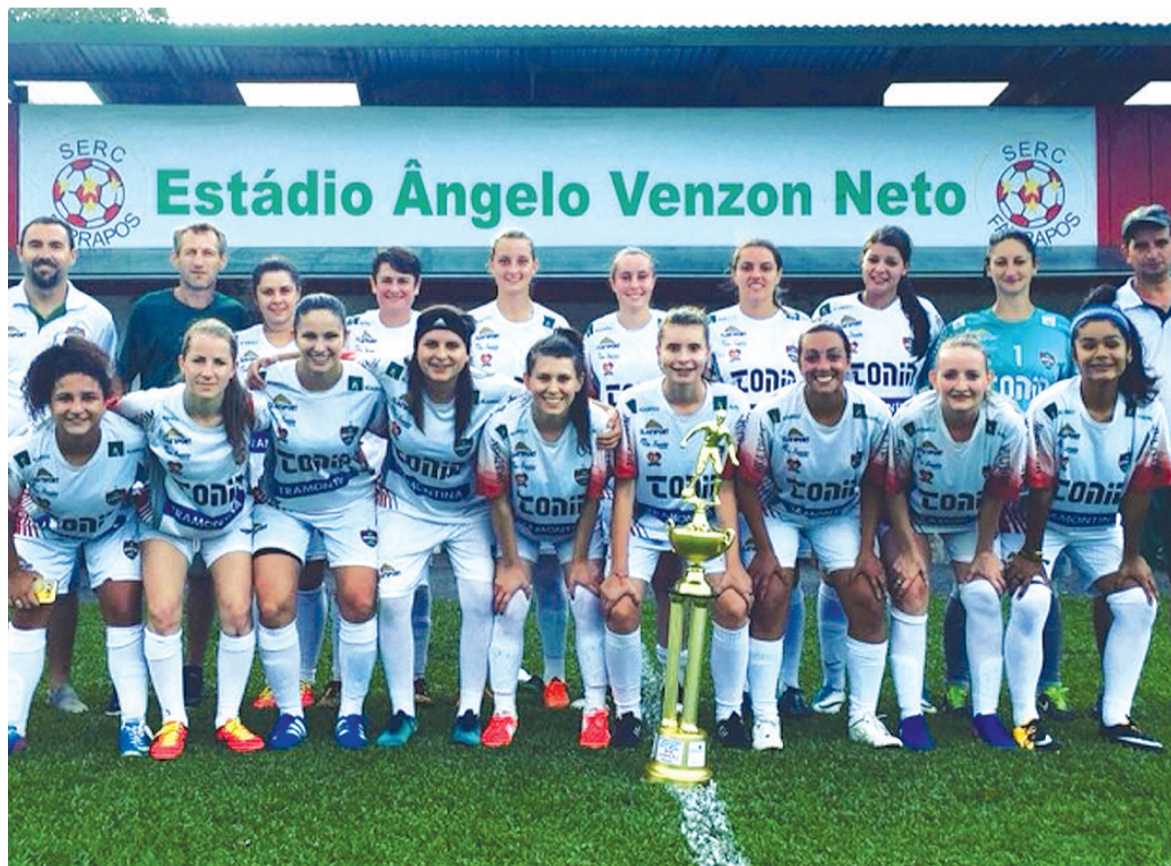
O grupo de atletas, que está junto desde fevereiro de 2017, intensificou sua preparação nos últimos meses visando a competição estadual

Desde 2017, a equipe feminina disputou diversas competições na região, visando a evolução do grupo de atletas dentro das quatro linhas. No Citadino de Caxias do Sul, a equipe Rubro-Verde sagrou-se vice-campeã do torneio. Em fevereiro deste ano, a equipe foi campeã do Torneio Ângelo Venzon Neto, de Farroupilha, finalizando a competição de forma invicta.