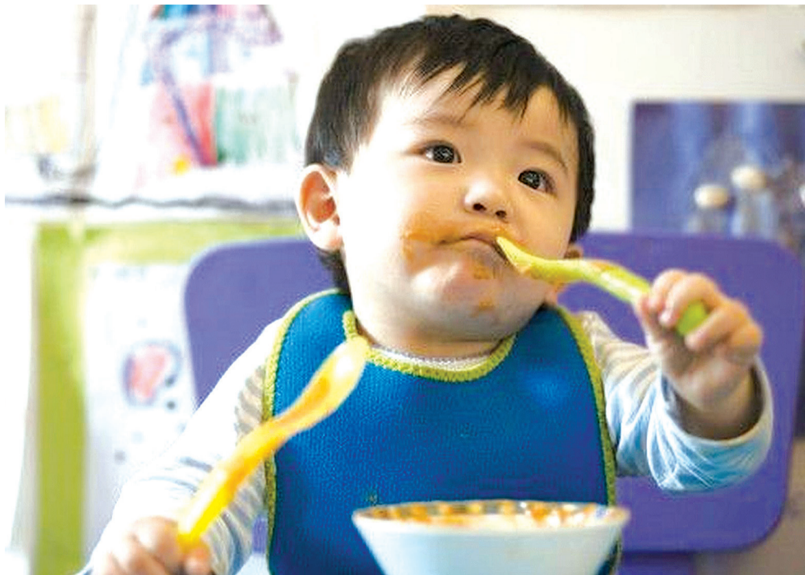
Bebês que comem alimentos sólidos mais cedo dormem melhor, revela estudo

Um porta-voz da FSA disse: "Estamos encorajando todas as mulheres a seguir os conselhos atuais para exclusivamente amamentar pelos primeiros seis meses de idade".