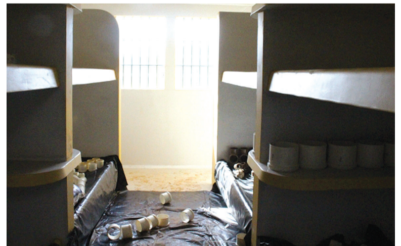
35 das 44 celas já estão concluídas