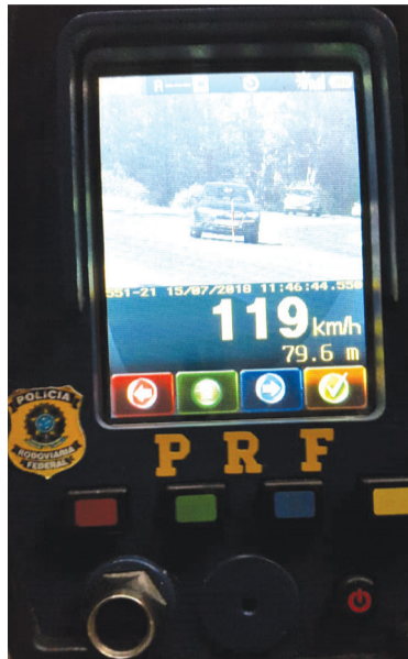
Foi verificado excesso de velocidade na rodovia