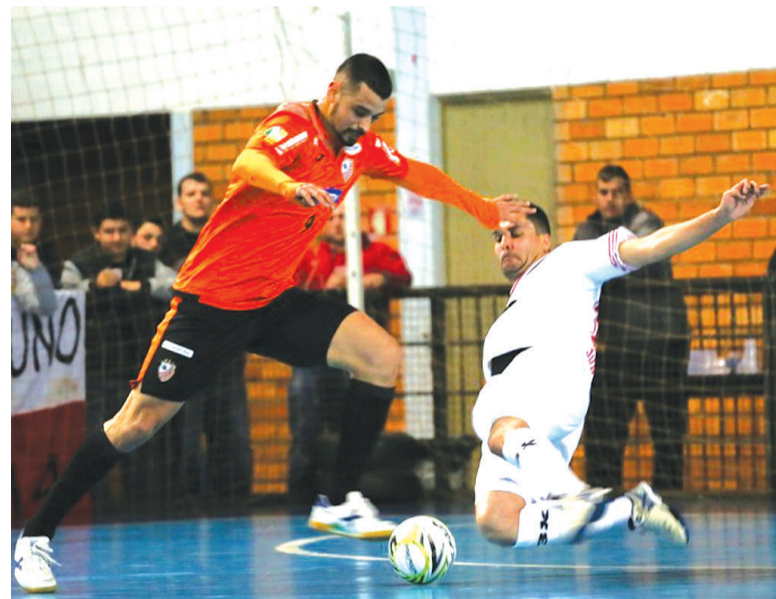
O time laranja segue na liderança da Liga Gaúcha com 26 pontos

O time laranja segue na liderança isolada da Liga Gaúcha. A próxima partida será na quarta-feira, contra o Guarany, em Espumoso.