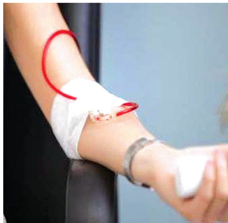
Durante experimentos, o pesquisador percebeu que doações generosas incentivaram um maior número de participantes do que contribuições menores