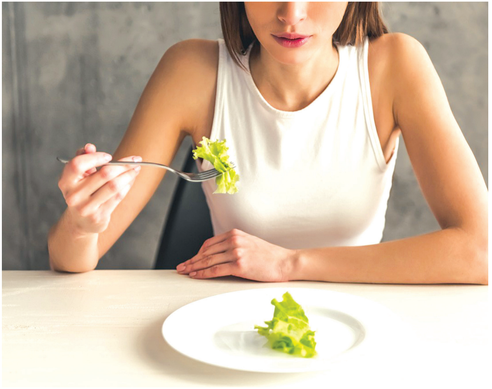
Diferentemente da anorexia e da bulimia, o quadro é marcado pela obsessão pela pureza do que se come

A pessoa ortoréxica, inicia uma busca obsessiva por normas (ou regras) de alimentação saudável. Também associa uma preocupação com a forma de preparo e os utensílios utilizados na preparação dos alimentos. Comer fora de casa é considerado um problema, evitam reuniões sociais e jantares para não “cair na tentação” de ingerir outro tipo de produto e pesam os alimentos e sentem “grande culpa se quebrar as regras”, e pelo contrário sentem uma sensação confortável ao fazer um prato elaborado exclusivamente com produtos orgânicos, ecológicos, bio ou com determinados certificados de salubridade. Acabam se isolando para conseguir se alimentar dessa forma saudável ou com alimentos considerados “puros” em casa, não aceitando comer em restaurantes e dessa forma acabam deixando de sair com os amigos ou namoradas/os. A dieta “saudável” acaba tomando