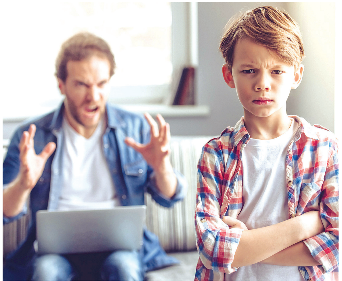
Dois pesquisas de importantes universidades norte-americanas sugerem que grito modifica o cérebro

A Harvard Medical School, também estudou o assunto, através do departamento de psiquiatria, e afirma que o abuso verbal, os gritos, a humilhação ou a combinação dos três elementos alteram de forma permanente a estrutura cerebral da criança. Depois de analisar mais de 50 crianças com transtornos psiquiátricos causados por problemas familiares e compará-las com quase 100 crian-