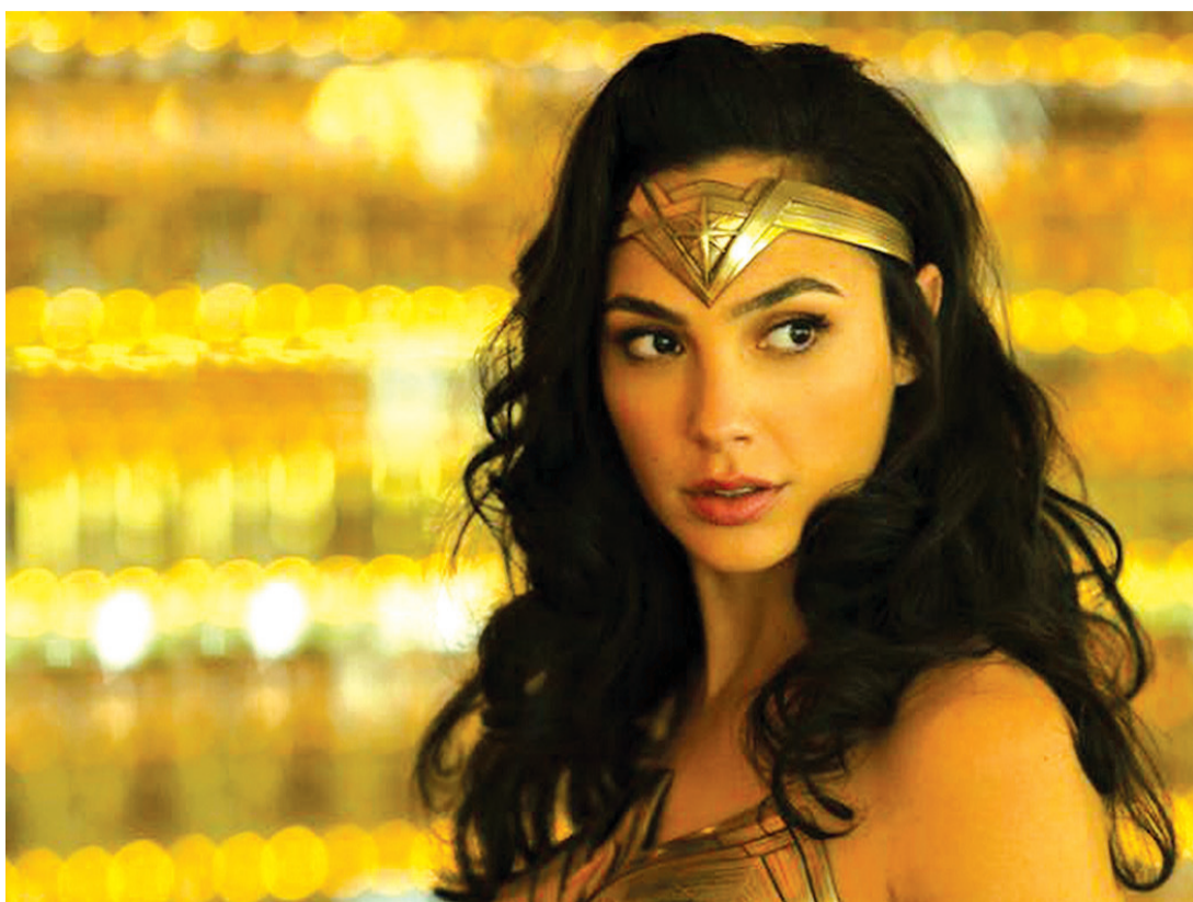
Gal Gadot publicou foto em que aparece como a heroína da DC no Instagram

Gal é israelense e chegou a servir dois anos nas Forças de Defesa de Israel, como instrutora de combate. Em 2004 conquistou o título de Miss Israel. Ela é mãe de Alma, de 6 anos e Maya, de 1.