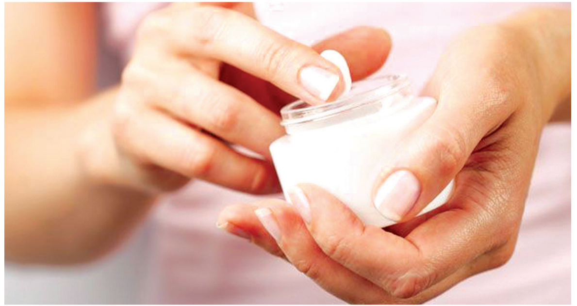
Não descuidar da hidratação, acertar a temperatura da água do banho, usar os cosméticos certos são alguns dos cuidados que não podem faltar

O clima seco prejudica também os lábios, que possuem uma pele fina e acabam rachados com