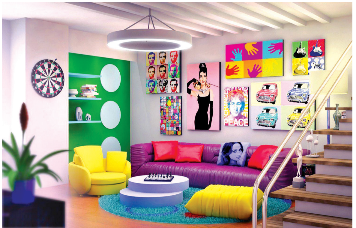
Uma sala com parede rosa e objetos coloridos é para quem tem um estilo mais extravagante