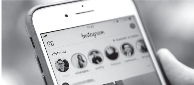
A novidade foi informada pela rede social ao BuzzFeed News no último dia 14

A rede social, porém, manterá a informação de quem viu os Stories.