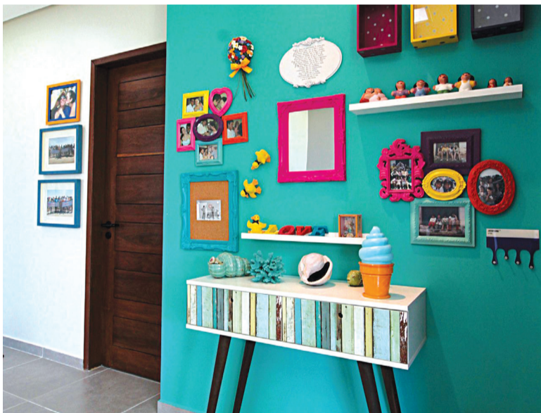
A parede verde também é tendência para quem quer uma cor mais extravagante