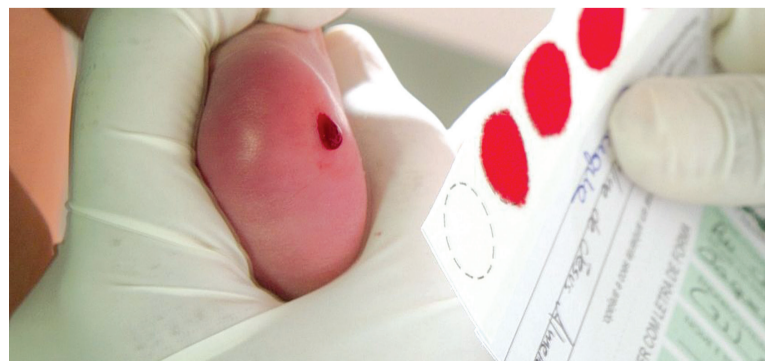
Na rede pública, teste do pezinho diagnostica seis doenças

O Sistema Único de Saúde (SUS) ainda garante o atendimento com médicos especialistas (Atenção Especializada) a todos os pacientes triados. Para as seis doenças detectadas no programa, há tratamento adequado, gratuito e acompanhamento por toda a vida.