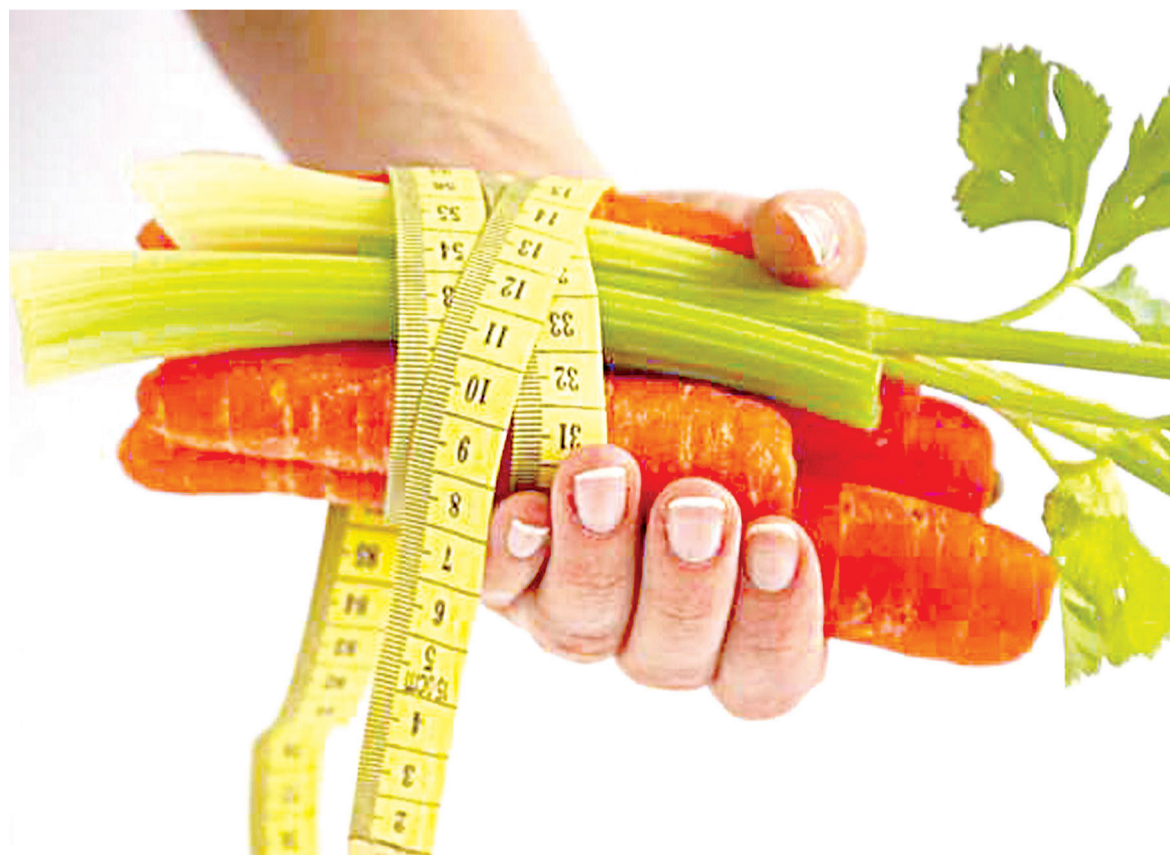
O tratamento da ortorexia deve ser realizado por profissionais da saúde. O acompanhamento de médicos, nutricionistas e psicólogos é fundamental

de desempenhar trabalhos ou de estudar pode começar a declinar, à medida que a sua mente se ocupa cada vez mais com a sua dieta e com os alimentos que são