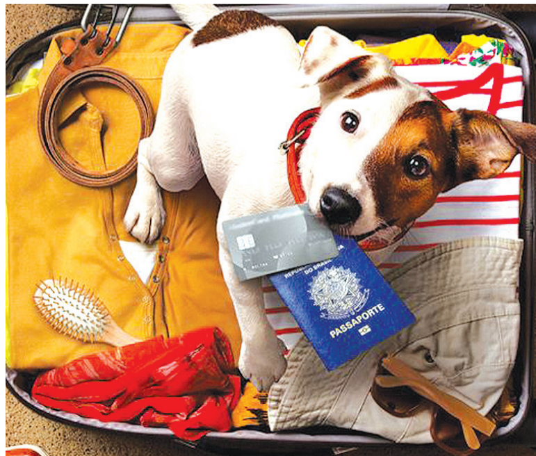
Com processo digitalizado, usuário vai gastar R$ 956,18 para levar pet viajar, R$500 a menos que atualmente

Através do endereço eletrônico http://www.agricultura.gov.br/assuntos/vigilancia-agropecuaria/animais-estimacao/sair-do-brasil/sair-do-brasil , é possível ver o passo a passo para obter o CVI e também as exigências específicas de cada país. Programe-se para que o atendimento para solicitar o CVI ocorra entre 10 e 2 dias antes da data da viagem, de modo que imprevistos não impeçam seu animal de embarcar. Portanto, a sugestão é contatar as unidades emissoras de CVI com, no mínimo, 30 dias de antecedência, uma vez que os atendimentos estão sujeitos a agendamento prévio.