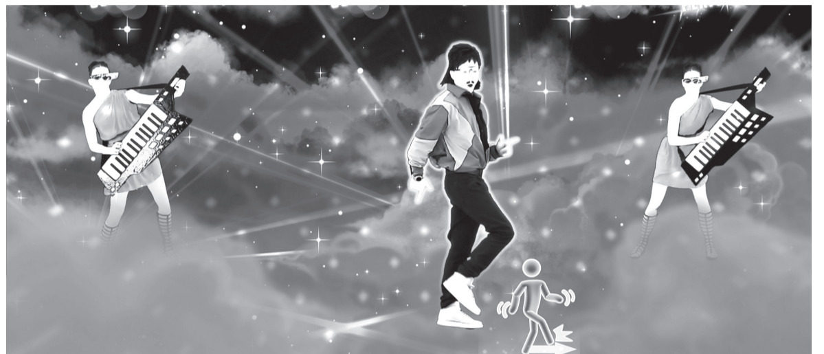
"Just Dance 2019" será lançado em outubro com 40 músicas inéditas, incluindo ainda "Finesse (Remix)", de Bruno Mars e Cardi B, e "Shaky Shaky", de Daddy Yankee

Ivete Sangalo, com "Dançando", e Anitta, com "Bang", estão entre os brasileiros que já emplacaram músicas no "Just Dance".