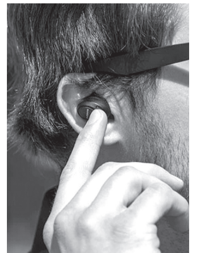
O Firefly é um fone de ouvido do tipo earbud que promete concorrer com os AirPods da Apple

De acordo com a fabricante do Firefly, o fone sem fio é concorrente dos AirPods, vendidos por R$ 1.399 no Brasil. No entanto, o aparelho com projeto no Kickstarter oferece bateria para apenas quatro horas de reprodução direta, enquanto o earbud da Apple promete atingir cinco horas de autonomia. Ambos contam com case para carregamento portátil. No caso do modelo da Jabees, a carga é de até 16 horas, enquanto os AirPods podem chegar a 24 horas.