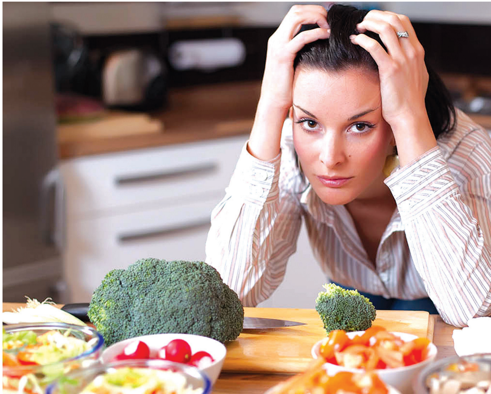
Um dos problemas da disfunção é que a pessoa pode sofrer com isolamento, evitando comer em restaurantes ou de se reunir para jantar com amigos

indivíduo começa a restringir alguns alimentos ou grupos alimentares inteiros. Em seguida, a obsessão se instala