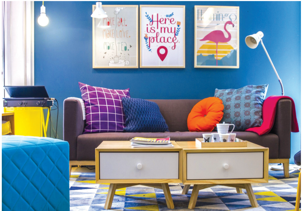
O azul é uma cor indicada para quem busca algo mais descolado, alegre e que passe a sensação de calma

Com um estilo que é tendência o ambiente traz traços da decoração industrial ao mesclar peças de metal e parede de cimento queimado. O resultado é um espaço bem moderno por conta da mistura de estilos, o que deixa a proposta jovem. A sala grande exige uma decoração que se estenda por todo o ambiente a fim de deixá-la aconchegante.