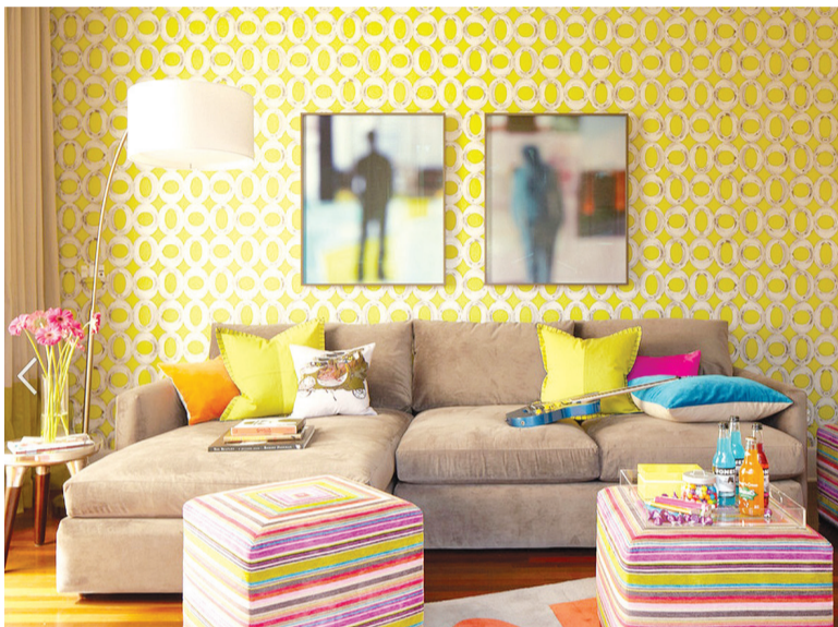
A parede amarela também está em tendência na decoração moderna