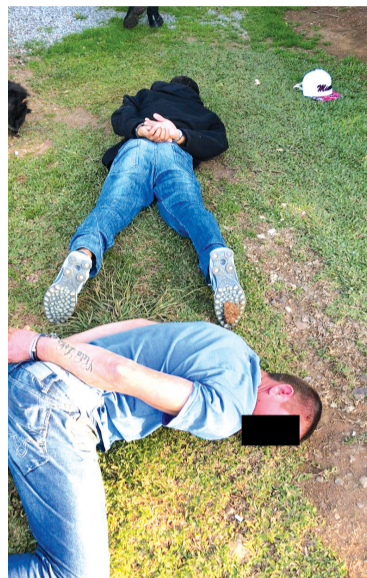
Tráfico de drogas, receptação, estupro e furto são alguns antecedentes dos criminosos