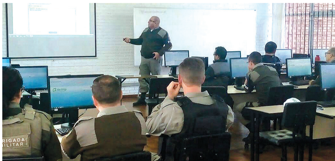
Ideia é expandir tecnologia já usada em Bento Gonçalves para outros municípios

A solução do Sistema Nacional de Informações de Segurança Pública (Sinesp) oferece suporte aos serviços públicos emergenciais, integrando o atendimento de forças de segurança pública e outros órgãos (Polícia Militar, Polícia Civil, Corpo de Bombeiros Militar, PRF, Guardas Municipais, etc.) além de otimizar a gestão de recursos, diminuir o tempo de resposta e melhorar o planejamento operacional.