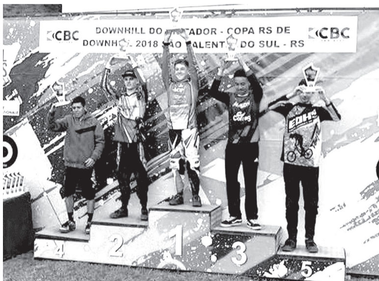
Atletas subiram ao pódio na última etapa da Copa RS de Downhill

O próximo desafio da ADHV será nos dias 28 e 29 de julho, quando a equipe participa do Campeonato Brasileiro de Downhill, no município de São Vedelino, reunindo atletas de diversas partes do país para a disputa da competição nacional da modalidade.