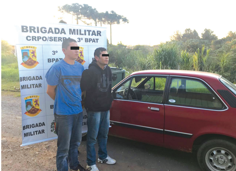
Dupla tem diversos antecedentes criminais