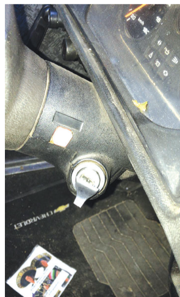
Os criminosos utilizaram um garfo para ligar o veículo