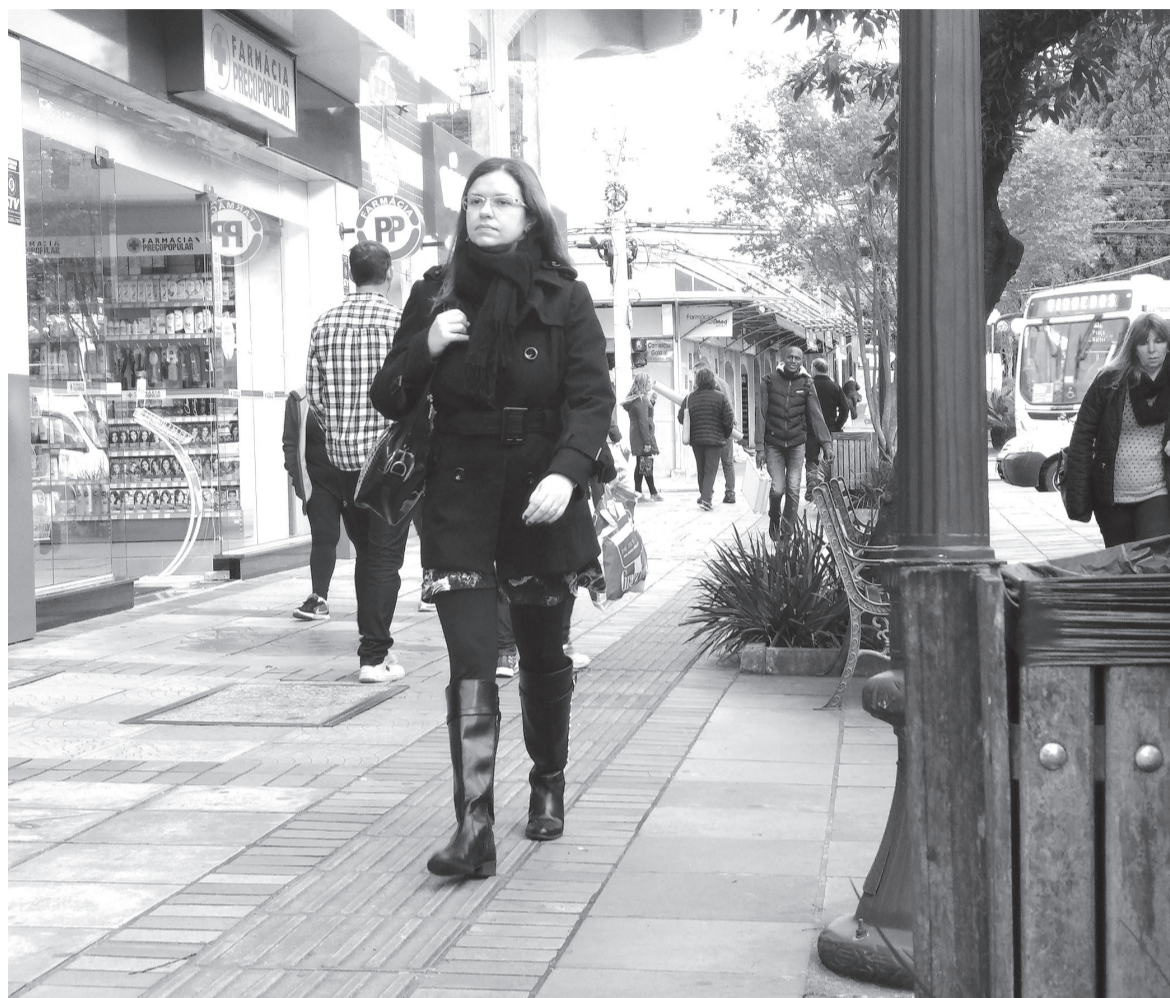
Inverno deve ser mais frio que do último ano, porém com temperaturas oscilantes

O El Niño é um aquecimento anormal do oceano Pacífico que deixa secos o Norte e o Nordeste do Brasil, provoca muita chuva no Sul e deixa Sudeste e Centro-Oeste mais quentes.