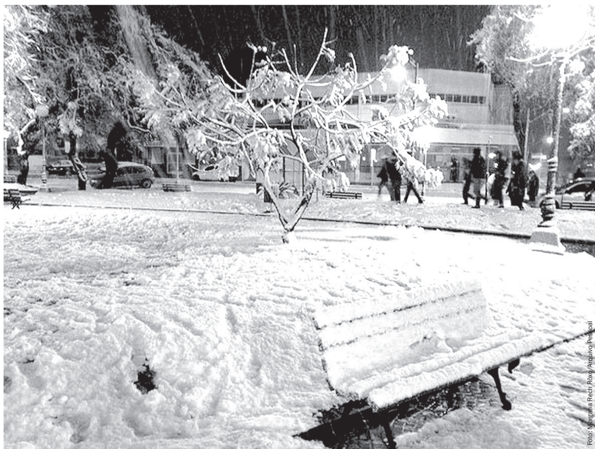
Neve registrada e Vacaria no inverno de 2013

Numa madrugada, o Rio Grande do Sul teve registro de neve em pelo menos 25 cidades, com uma temperatura mínima de -1,3°C. Bento Gonçalves chegou a registrar até -4°C.