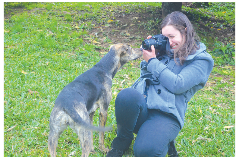
Fotos serão utilizadas como material publicitário para ajudar na adoção dos cães

Carina destaca também sobre a importância do trabalho abranger uma organização que desempenha a função de ajudar animais que aguardam uma adoção. “É um trabalho que proporciona uma experiência práti-