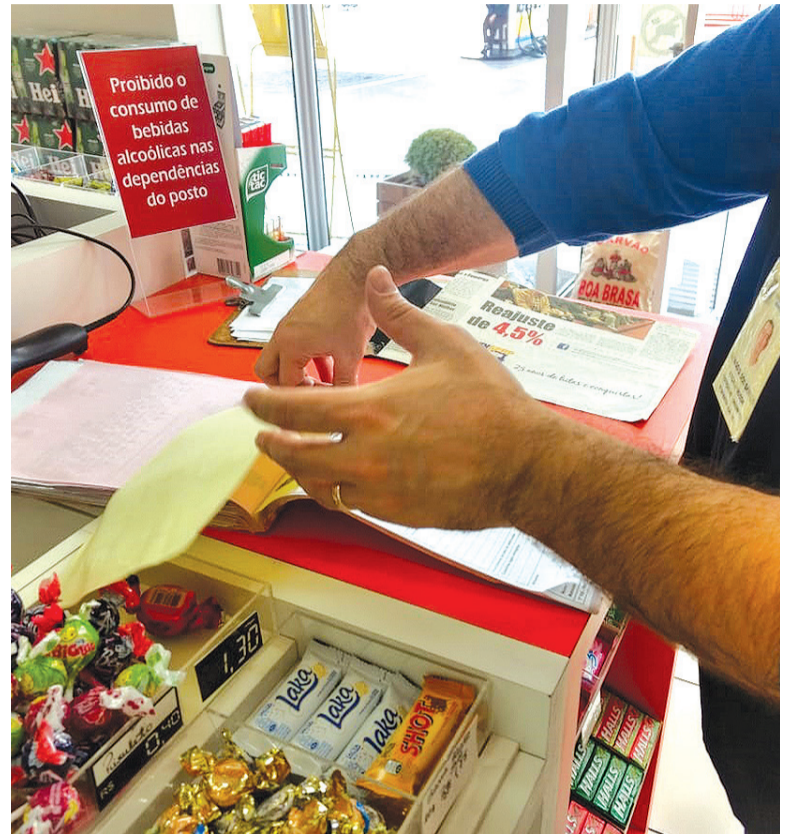
Procon vai fiscalizar 32 postos até esta sexta-feira, 22