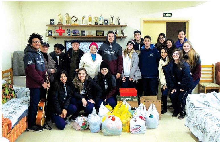
Lar do Ancião recebeu itens arrecadados no “dia temático hippie”, que aconteceu no dia 18 de maio

hippie”, que aconteceu no dia 18 de maio, com o intuito de promover ações de solidariedades, Paz e Amor -o lema do movimento. Os estudantes pretendem dar continuidade no projeto, engajando outras instituições.