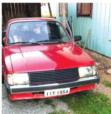
Veículo foi furtado próximo ao hospital, no centro de Bento Gonçalves