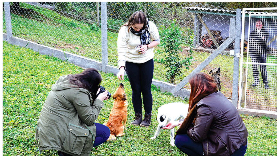
Estudantes realizaram o trabalho na última semana