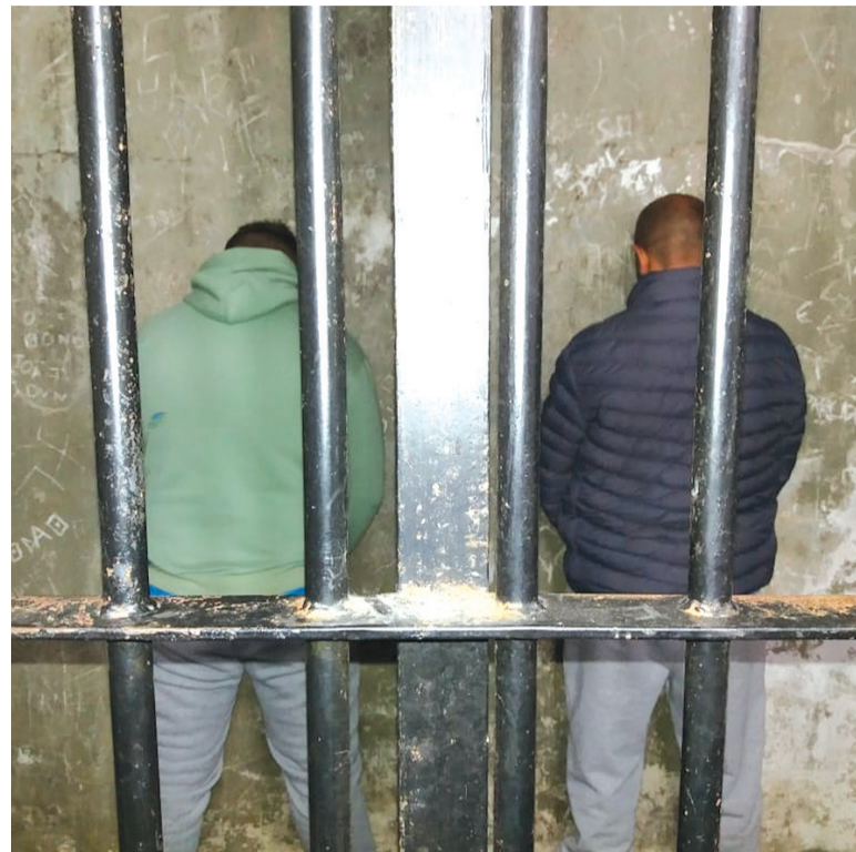
Homens foram presos em operação que investiga tráfico de drogas na modalidade tele-entrega

A ação foi coordenada pela 1ª Delegacia de Polícia de Bento Gonçalves, com o apoio de agentes da 2ª Delegacia de Polícia e policiais civis das Delegacias de Garibaldi, Carlos Barbosa e Farroupilha.