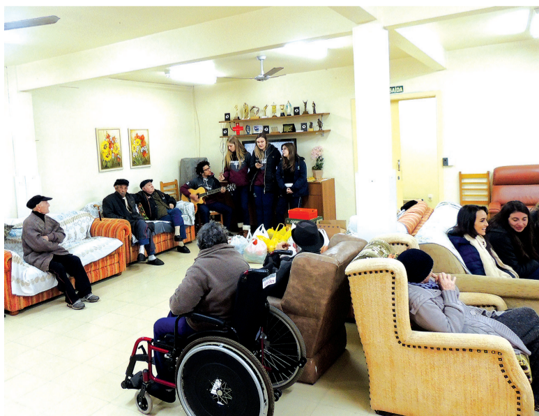
Estudantes pretendem ampliar o projeto, engajando outras instituições