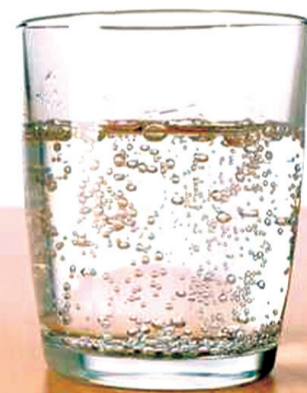
Para quem enfrenta aquela sensação de inchaço após o almoço, a bebida pode se tornar uma alternativa aos remédios para azia e má digestão

É preciso beber cerca de dois litros por dia, conforme as necessidades do organismo da pessoa. Se você tem dificuldade para bater a meta diária, pode recorrer à tecnologia. “Hoje já existem aplicativos para o celular que emitem avisos na hora de beber água, assim evitamos esquecimentos”, indica Giovanna.