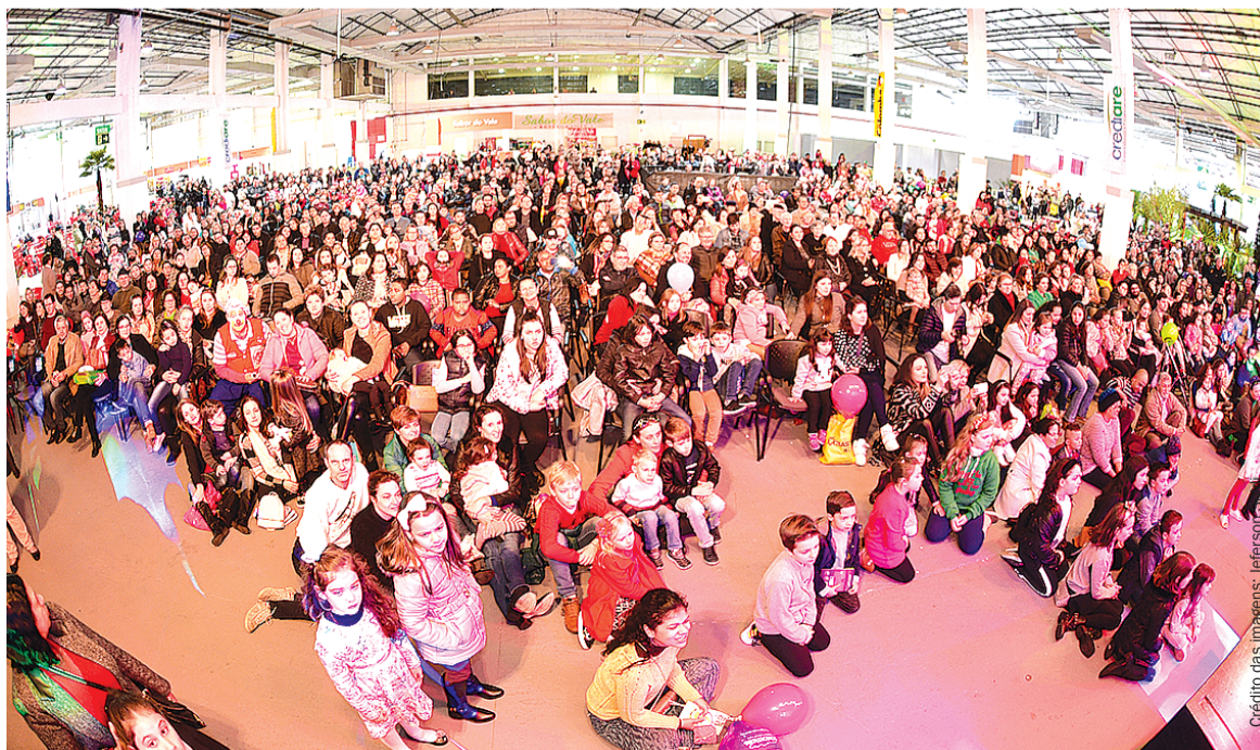
A feira contribuiu, mais uma vez, para fomentar o desenvolvimento econômico da região