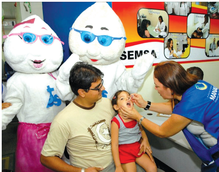
O alerta veio após uma criança não vacinada na Venezuela contrair o vírus da poliomielite no início do mês

O governo brasileiro espera que a meta seja atingida tanto na vacinação de rotina (a vacina contra a poliomielite é oferecida o ano inteiro), quanto nas campanhas em que se faz um esforço adicional para chamar a atenção da população. Neste ano, a campanha contra a poliomielite será feita entre 6 e