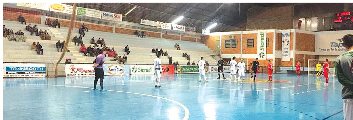
Com o resultado, a equipe segue sem vencer na competição estadual