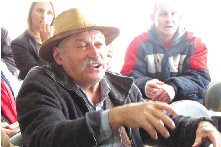
Morador relata que postes estão em condições precárias no interior