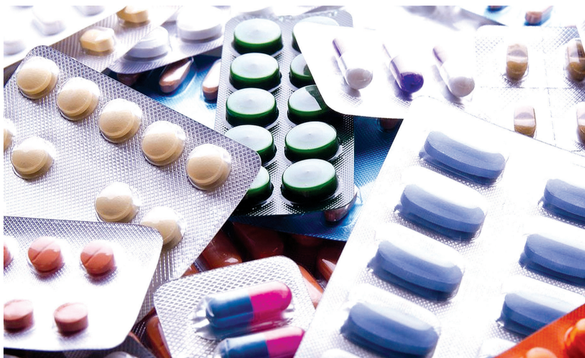
Farmacêuticas têm 140 terapias em desenvolvimento mirando tratar doenças de saúde mental, incluindo 39 delas para o combate à depressão, de acordo com o grupo comercial Produtores e Pesquisadores Farmacêuticos da América

Farmacêuticas têm 140 terapias em desenvolvimento mirando tratar doenças de saúde mental, incluindo 39 delas para o combate à depressão, de acordo com o grupo comercial Produtores e Pesquisadores Farmacêuticos da América. O número é baixo se comparado com as 1100 drogas experimentais de combate ao câncer, produzidas pela mesma indústria, e que podem receber alguns dos preços mais altos.