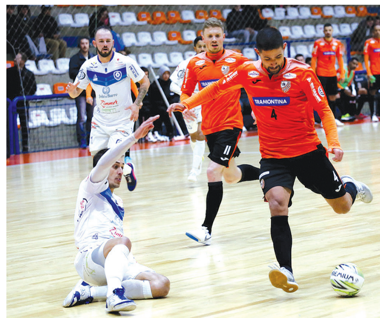
A ACBF tem 13 pontos em seis jogos disputados