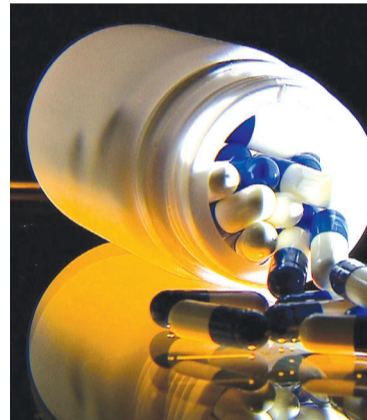
A substância, conhecida pela ciência desde 1939, é produzida naturalmente pelo corpo humano e está presente no leite materno

a União, a Anvisa, o Estado de Minas Gerais e o município de Uberlândia adotem todas as medidas administrativas necessárias para que, no prazo de 90 dias, a substância Fosfoetanolamina sintética seja disponibilizada no Sistema Único de Saúde (SUS) para todos os pacientes que tenham indicação de recebê-la.