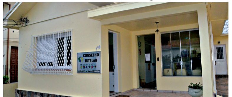
Conselheiros farão curso de capacitação aberto ao público

Os temas abordados serão: Combate à exploração do trabalho infantil; Nova lei de crimes sexuais e o Conselho Tutelar; O ciclo de aplicação de medidas; Trabalho em rede pela infância; Conselho tutelar e o atendimento da criança vítima de violência; Estatuto da Criança e do Adolescente no cotidiano escolar; Indisciplina e ato infracional: soluções e encaminhamentos; e Violência sexual e pedofilia. Os interessados podem se inscrever por meio do link: http://cursos.bentogoncalves.rs.gov.br/cursos .