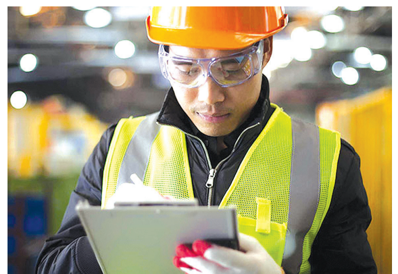
Há cinco vagas para agente de inspeção de qualidade

mengueadvogados@globocom | Osvaldo Aranha, 746 - s/01