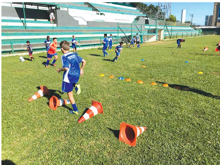
O Esportivo tem 150 crianças de 6 a 15 anos, que frequentam a escola do clube, e 30 jovens na categoria sub 17

A equipe de Bento ocupa até então a 14ª colocação na classificação geral do campeonato. Na próxima rodada, o BGF visita o UJR, na segunda-feira, às 15h30, em novo Hamburgo, em partida antecipada da 12ª rodada, válida já pelo retorno da competição.