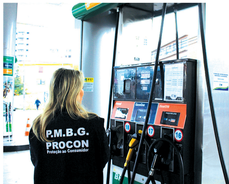
Órgão deve visitar pelo menos 26 postos da cidade

estruturas de aço (1); Montador de mármore (1); Motorista carreteiro (3); Operador de telemarketing ativo (2); Representante comercial autônomo (1); Sinaleiro (orientação de guindastes e equipamentos similares) (1); Soldador (1); Técnico em saúde bucal (1); Técnico em segurança do trabalho (1); Técnico mecânico (equipamentos médicos e odontológicos) (1); Vendedor - no comércio de mercadorias (2); Vendedor interno (2). Os interessados devem comparecer na agência, na Rua Marechal Floriano, 142, a partir das 8h. Mais informações através dos telefones (54) 3451-5822 / 3452-4824.