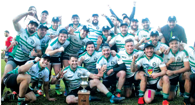
Com grande atuação ofensiva, o Farrapos dominou os 80 minutos de jogo, controlando as ações da partida e atacando intensamente o adversário

No segundo tempo, apesar da desvantagem numérica dentro das quatro linhas, o Farrapos manteve a regularidade dentro de campo e continuou pressionando os adversários. Com jogadas em velocidade