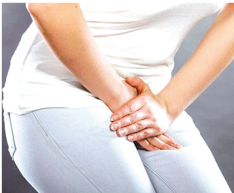
O tratamento para combater a infecção urinária é feito por meio do uso de antibióticos, sendo este normalmente escolhido de acordo com o resultado da urocultura

Inserção de corpos estranhos na uretra, pois estes podem carregar bactérias para o interior do trato urinário;