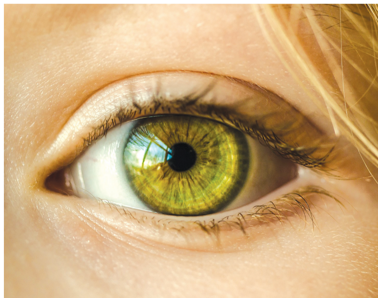
Em linhas gerais, o glaucoma se caracteriza por alterações na pressão dentro dos olhos