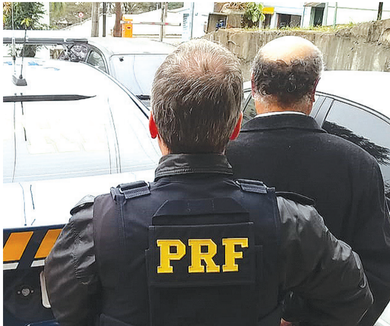
Homem foi autor de homicídio em 1999

Justiça e é autor de um homicídio em Alvorada, na região metropolitana, em 1999. Após a prisão, o mesmo foi levado à polícia judiciária de Bento Gonçalves para os procedimentos cabíveis.