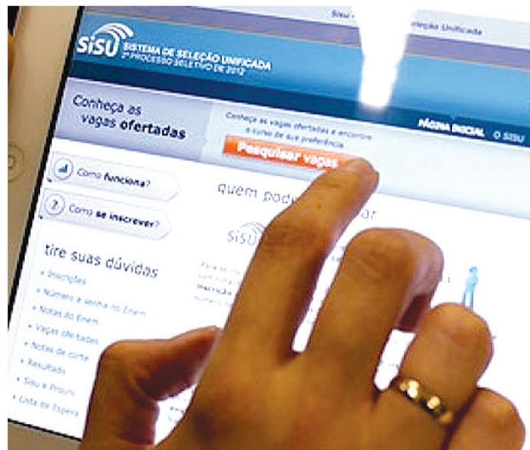
Os estudantes selecionados deverão fazer a matrícula nas instituições de ensino entre 22 e 28 de junho

As vagas serão oferecidas em oito instituições públicas estaduais, uma faculdade pública municipal e 59 instituições públicas federais, com dois centros de Educação Tecnológica, 27 institutos federais de Educação, Ciência e Tecnologia e 30 universidades.