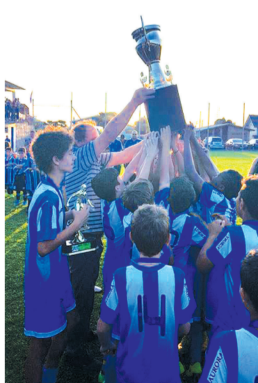
São cerca de cinco horas de atividade que ocorrem sempre no turno oposto ao das aulas