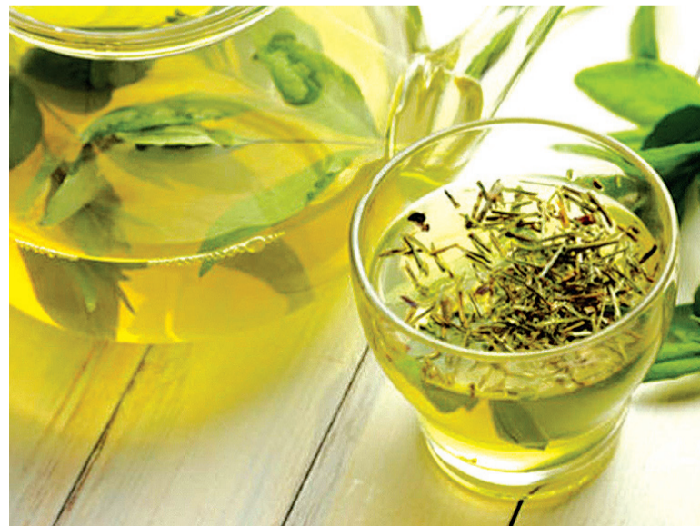
Dentre seus vários benefícios para a saúde, as propriedades do chá-verde também estão ligadas ao emagrecimento

Dentre seus vários benefícios para a saúde, as propriedades do chá-verde também estão ligadas ao emagrecimento. Segundo estudo, o extrato do chá-verde aumenta o gasto energético, a oxidação de gordura e é desintoxicante, por possuir efeitos diuréticos.