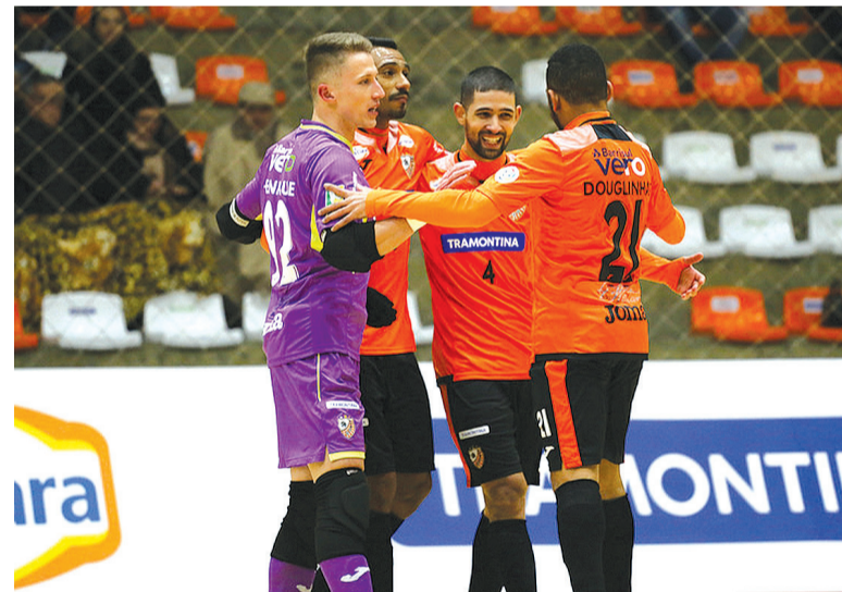
A equipe da Capital Nacional do Futsal começou criando as primeiras chances e não demorou muito para as redes balançarem