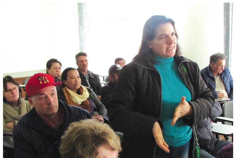
Marivete explica que as doses da vacina que são aplicadas no marido, que sofre de esclerose múltipla, terão que ser descartadas