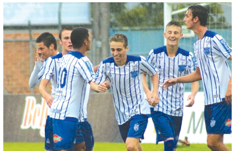
Ao ingressar no projeto, os jovens são organizados conforme a idade em divisões que são do Sub 6 ao Sub 17

Com o resultado, o Esportivo chega aos 14 pontos conquistados na competição, abrindo uma vantagem de seis pontos em relação ao Cruzeiro, primeira equipe fora da zona de classificação. Na próxima rodada, a equipe de Márcio Ebert recebe o Progresso de Pelotas, no sábado, dia 23, às 15h, no Estádio Montanha dos Vinhedos.