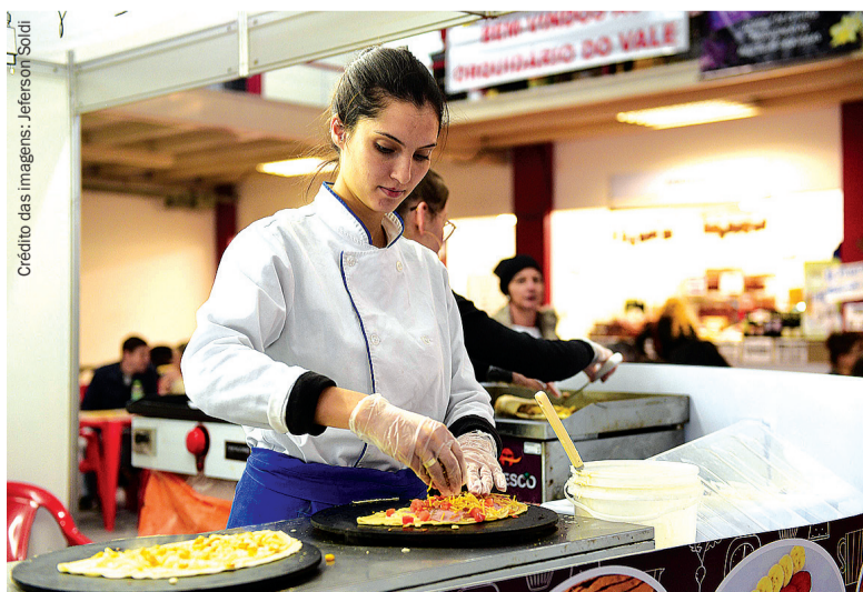
Foram movimentados R$ 40 milhões em negócios durante os 11 dias de programação

Para o público adulto, renomados chefs de cozinha ministraram 10 aulas-show. Delas, participaram cerca de 400 pessoas. Além disso, 15 cursos de degustação com vinícolas da região serrana puderam aperfeiçoar o paladar de mais de 600 interessados em imergir no mundo do vinho. A iniciativa teve apoio da Cooperativa Santa Clara, Orquídea Alimentos e Itálinea Móveis Planejados. A realização foi do Senac Gastronomia.