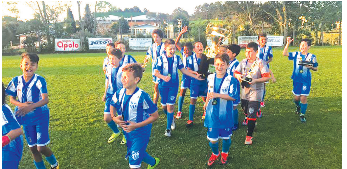
Muito mais do que celeiro de jogadores para a equipe profissional, a iniciativa contribui de forma prática com a promoção do bem-estar social

Os jovens interessados em participar da escolinha devem fazer a matrícula na secretaria do clube, acompanhados de pais ou responsáveis. O período da chamada “peneira”, onde são feitas seleções mais amplas para a categoria sub 17, é no início do mês de fevereiro de cada ano. Há uma série de documentos necessários para a