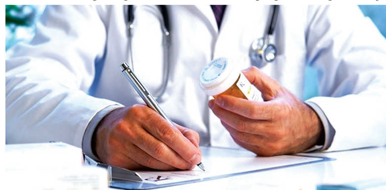
A fim de controlar a perda de massa óssea o médico poderá solicitar uma densitometria óssea a cada 1 ou 2 anos, a fim de ajustar a dose do medicamento

No entanto, a dieta para osteoporose não exclui a necessidade da ingestão dos medicamentos receitados pelo médico e fisioterapia.