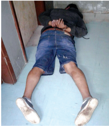
Homem foi preso depois de assaltar uma jovem

Ele foi detido depois de assaltar uma jovem de 18 anos.