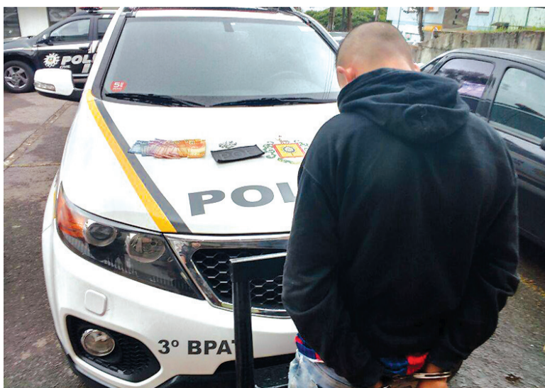
Menor foi flagrado em conhecido ponto de drogas no Eucaliptos

que encontrou A.M.S., de 17 em um conhecido ponto de drogas do bairro. Com ele foi localizada a quantia de R$ 198,00 e 19 pedras de crack. O menor foi conduzido a DPPA para lavratura do registro.