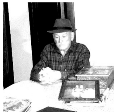
Em 2011, uma produtora de Porto Alegre fez um documentário sobre a vida do pracinha

O agricultor de Tuiuty contou para a repórter que foram cinco dias