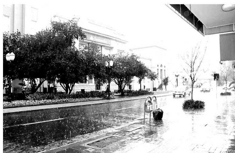
o domingo, as áreas de instabilidade ficam ainda mais fortes, e o tempo fica chuvoso durante o dia e a noite, com quase 30 mm de precipitação