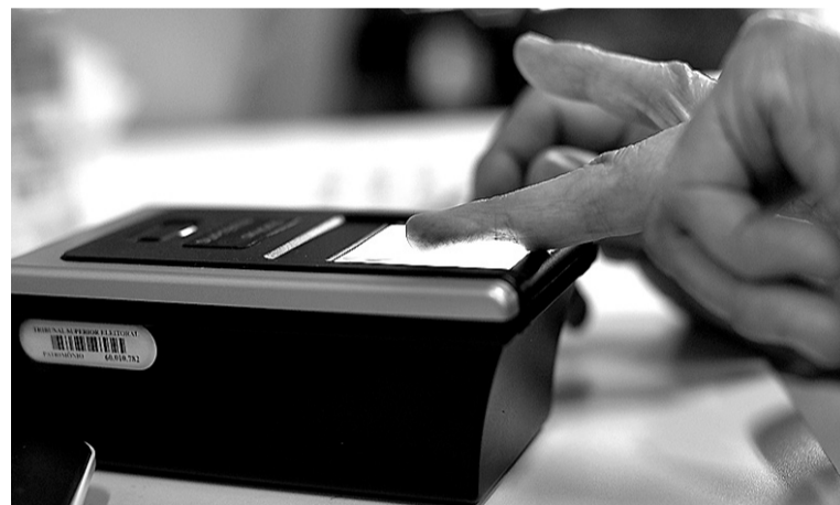
O título de eleitor, segundo a legislação, é o único documento que fica suspenso caso o cidadão não compareça a biometria ou fique sem votar e sem justificar a ausência por até três eleições

Os documentos apresentados devem estar em seu original. Se você tiver o Título Eleitoral anterior, traga-o (se o tiver perdido, não é necessário trazer o boletim de ocorrência).