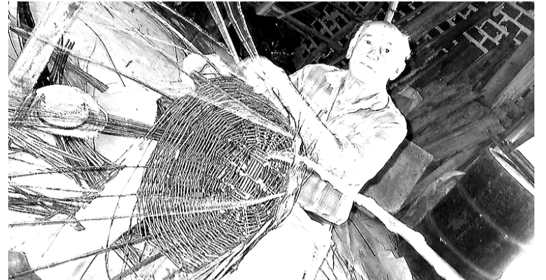
Checo era morador de São Valentim do Sul, em Tuiuty

de viagem para atracar em Livorno, na Itália, onde ficaram um mês recebendo as instruções e vacinas necessárias. "Eram mais de 11 mil soldados com febre, deitados em baixo de uma lona por causa das injeções. Depois, nos avisaram: é hora de matar ou morrer, acabou a brincadeira, e aí fomos para o front, onde fiquei por sete meses e meio, sempre nas trincheiras. Os tiros não paravam, não dava para acreditar naquilo. Os alemães tinham metralhadoras que disparavam 1,2 mil tiros por minuto. Lembro que nos primeiros ataques fomos bem, foram poucos feridos e 1 ou 2 mortos, mas depois passamos por um triste episódio", lamentou.