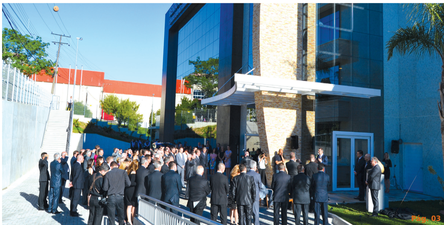
Autoridades prestigiam evento que marcou o início de uma nova era para os empresários do município