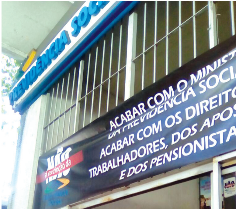
Nova reforma deve ser votada ainda em dezembro pelos deputados

Segundo Maia, o texto propõe o nivelamento dos salários de aposentadorias entre os trabalhadores brasileiros. Atualmente, servidores públicos podem se aposentar recebendo o teto remuneratório do serviço público federal de R$ 33,7 mil, o correspondente ao salário de ministro do Supremo Tribunal Federal (STF). Já os trabalhadores vinculados ao Regime Geral de Previdência Social recebem até R$ 5.531,31 mensalmente,