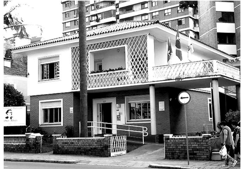
Inscrições vão até o dia 1º de dezembro

É preciso apresentar a inscrição no ato da matrícula. As inscrições vão até o próximo dia 1º de dezembro. O horário de funcionamento da Biblioteca é de segunda a sexta-feira, das 8h às 18h e aos sábados das 8h30 às 11h30. Qualquer dúvida, falar com Jorge.