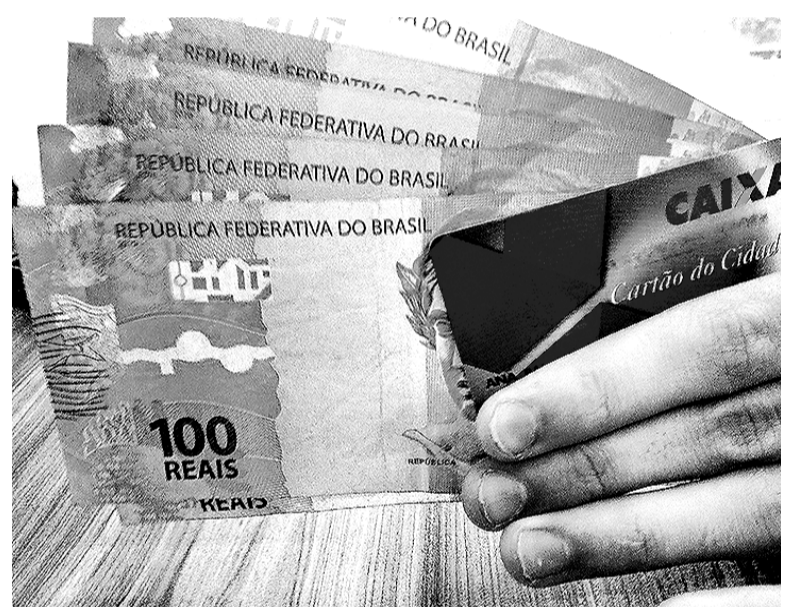
Saque começou na quinta para alguns grupos, mas abre universal na segunda-feira

Anteriormente, a programação de atendimento da 3ª fase de pagamentos das cotas do PIS/Pasep – Programa de Integração Social e Programa de Formação do Patrimônio do Servidor Público – previa saques a partir de 14 de dezembro. Com a antecipação, mais de 2 milhões de trabalhadores terão acesso aos recursos. O potencial de pagamentos desta terceira etapa é de que quase R$ 4 bilhões.