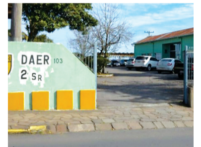
Área na Eugênio Valduga, na Licorsul, com vários prédios desativados, será leiloadada

Alto Feliz, André da Rocha, Antônio Prado, Barão, Bento Gonçalves, Boa Vista do Sul, Bom Princípio, Campestre da Serra, Carlos Barbosa, Caxias do Sul, Coronel Pilar, Cotiporã, Esmeralda, Fagundes Varela, Farroupilha, Feliz, Flores da Cunha, Garibaldi, Ipê, Linha Nova, Monte Belo do Sul, Muitos Capões, Nova Bassano, Nova Prata, Nova Pádua, Nova Roma do Sul, Pinhal da Serra, Pinto Bandeira, Protásio Alves, Salvador do Sul, Santa Cecília do Sul, Santa Tereza, São José do Sul, São Marcos, São Pedro da Serra, São Valentim do Sul, São Vendelino, Tupandi, Vacaria, Vale Real, Veranópolis, Vila Flor