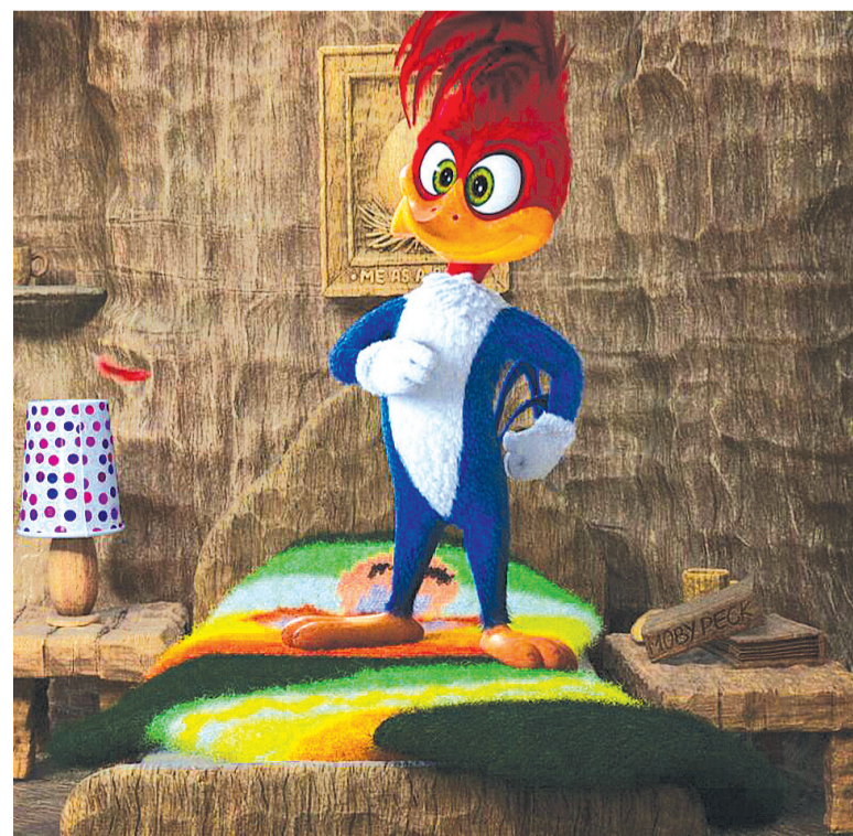
Cena do filme Pica-Pau o Filme