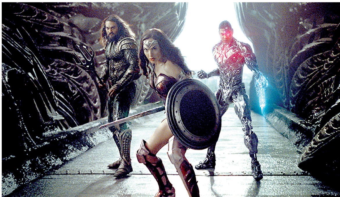
Cena do filme Liga da Justiça