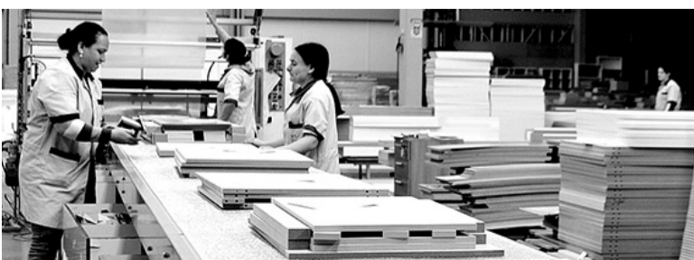
Nesse período, o setor que mais abriu postos de trabalho foi o da Indústria de Transformação

Nesse período, os setores que mais abriram postos de trabalho foram o da Indústria de Transformação, com 46 vagas a mais, seguido pelos serviços, com 34 vínculos