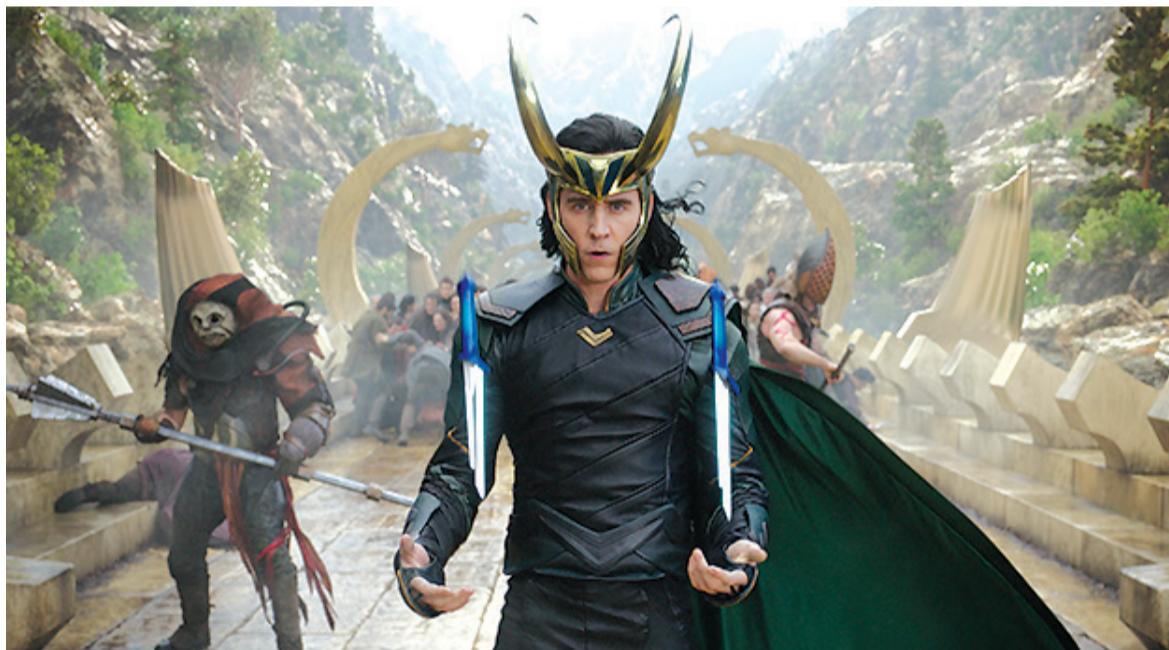
Cena do filme Thor Ragnarok

(2D) (Duração 2h11min/ Ação, Fantasia, Aventura/12 anos) Todos os dias -21 h -Dublado