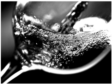
A feira deve acontecer em novembro do próximo ano

A empresa italiana, sediada na cidade de Verona, na região do Vêneto, tem mais de 100 anos de atuação, promove cerca de 32 feiras por ano, incluindo a Vinitaly, considerada uma das principais feiras vinícolas do mundo, e calcula um faturamento anual de cerca de 90 milhões de euros.