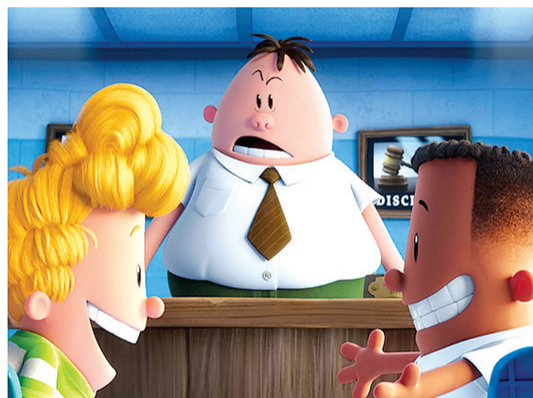
Cena do filme As Aventuras do Capitão Cueca