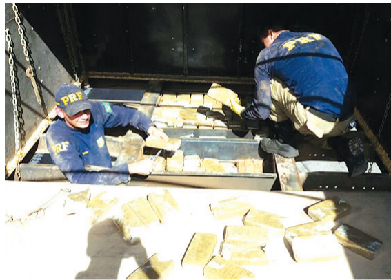
Tabletes renderiam mais de um milhão de papéletes de cocaína

Depois de processada, a pasta base poderia render mais de 1,5 milhão de papéletes de cocaína. O motorista foi preso e conduzido à polícia judiciária, onde foi autuado em flagrante pelo crime de tráfico internacional de drogas.