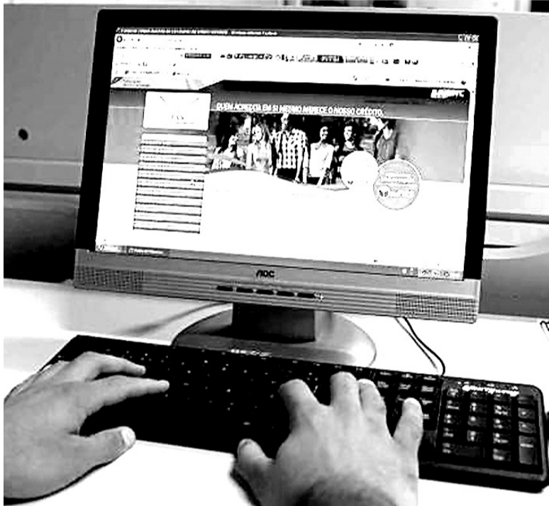
Prazo era para terminar nesta semana, mas foi prorrogado

Conforme levantamento do MEC, do total de 1,28 milhão de contratos previstos para o segundo semestre deste ano, 1.067.568 já haviam sido aditados até a última semana, o equivalente a 83%.