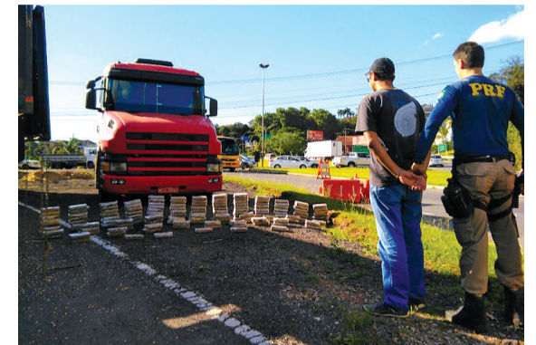
Drogas trazidas do Mato Grosso do Sul teriam como destino a região metropolitana de Porto Alegre