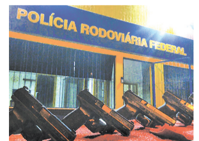
As cinco pistolas apreendidas são de fabricação turca e uso restrito

Esse medicamento, também conhecido como “rebite”, é muito utilizado por motoristas para se manterem acordados durante longas viagens, pois funciona como um estimulante, sendo sua comercialização proibida pela Anvisa. O condutor do veículo, de 36 anos, foi preso e conduzido à polícia judiciária de Caxias do Sul. Ele responderá pelos crimes de tráfico internacional de arma de fogo e contrabando.